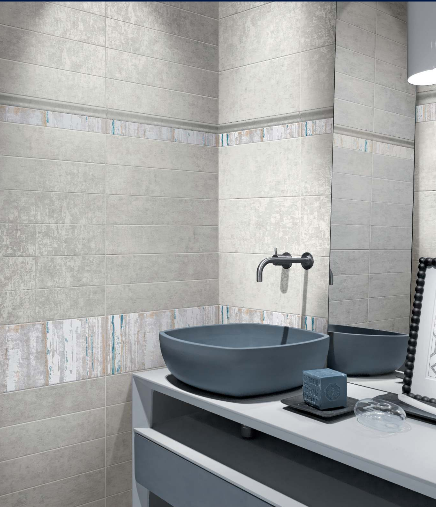
Alternata bianco/grigio 20x50 - alternata grigio 10x50 - decoro fascia righe COLD 20x50 - listello fascia righe COLD 6x50 - london grigio