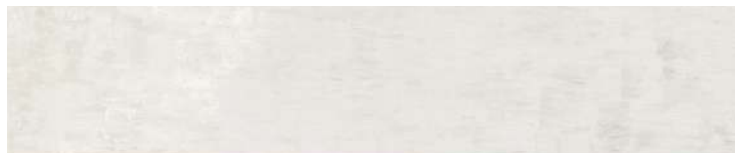
HAPV0800 07 neutro 10x50