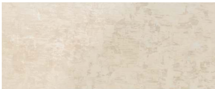
HAPV0806 11 beige 20x50