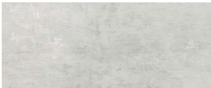
HAPV0797 11 grigio 20x50