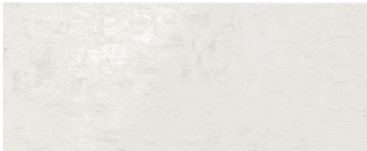
HAPV0798 11 neutro 20x50