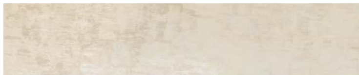
HAPV0810 07 beige 10x50