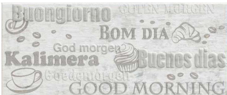
HAP03517 36 decoro cucina buongiorno alterna 20x50