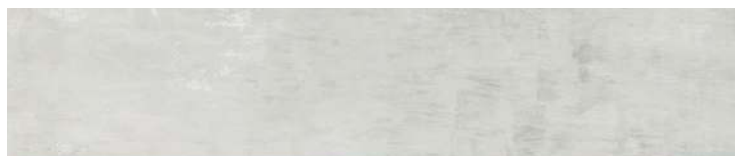
HAPV0801 07 grigio 10x50