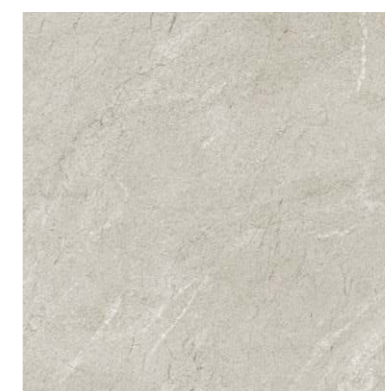
G-3031 / M / 600x600x9 Бежевый / Beige