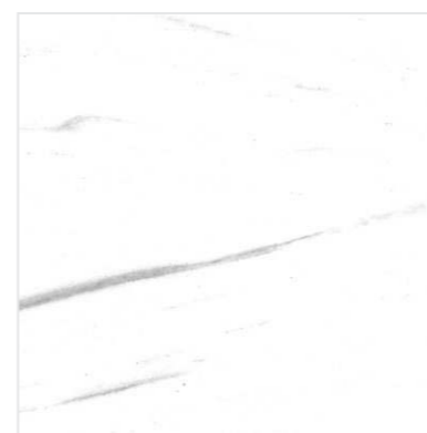
G-3030 / M / 600x600x9 Белый / White