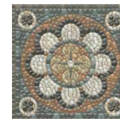
HGD/A432/5009 Стемма 20x20 Stemma