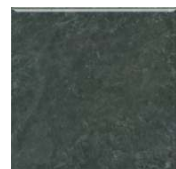
5290 Стемма зелёный тёмный 20x20 Stemma dark green