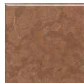
5289 Стемма коричневый 20x20 Stemma brown