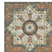
HGD/A434/5009 Стемма 20x20 Stemma