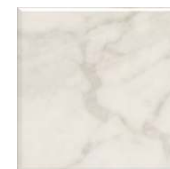
5287 Стемма белый 20x20 Stemma white