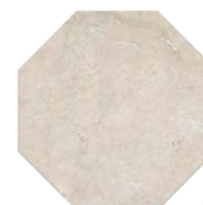
SG244200N Стемма бежевый 24x24 Stemma beige