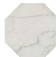
SG244100N Стемма белый 24x24 Stemma white