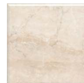
5288 Стемма бежевый 20x20 Stemma beige