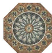
HGD/A438/SG2440 Стемма 24x24 Stemma