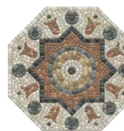
HGD/A437/SG2440 Стемма 24x24 Stemma