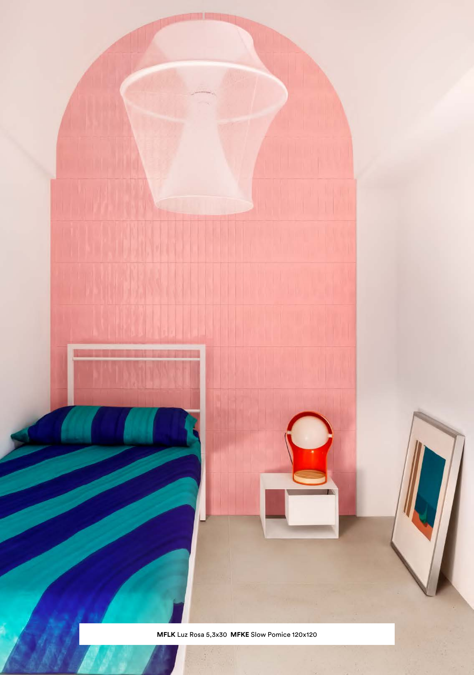
MFLK Luz Rosa 5,3x30 MFKE Slow Pomice 120x120