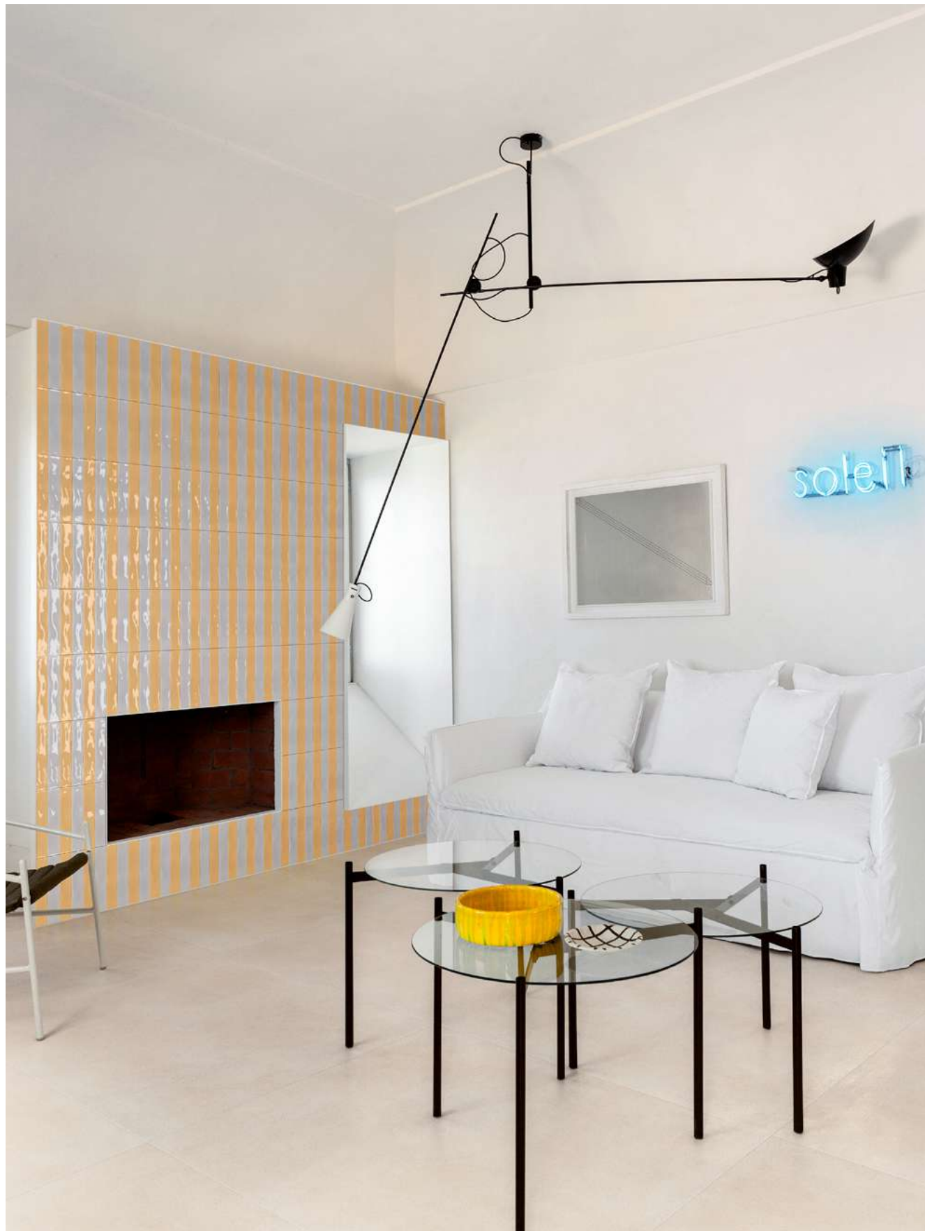
MFLE Luz Bianco 5,3x30 MFLJ Luz Giallo 5,3x30 MFKE Slow Pomice 120x120