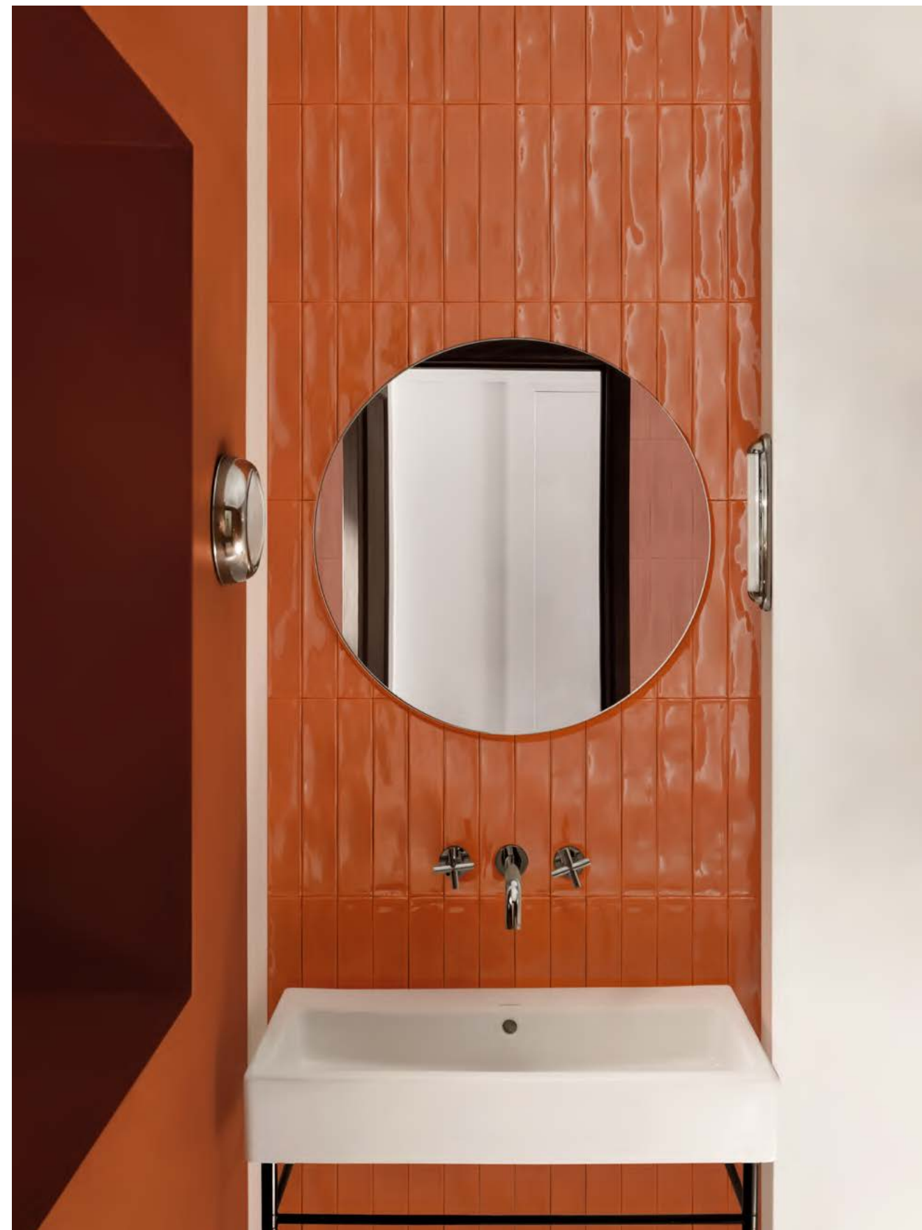
MFL Luz Aragosta 5,3x30