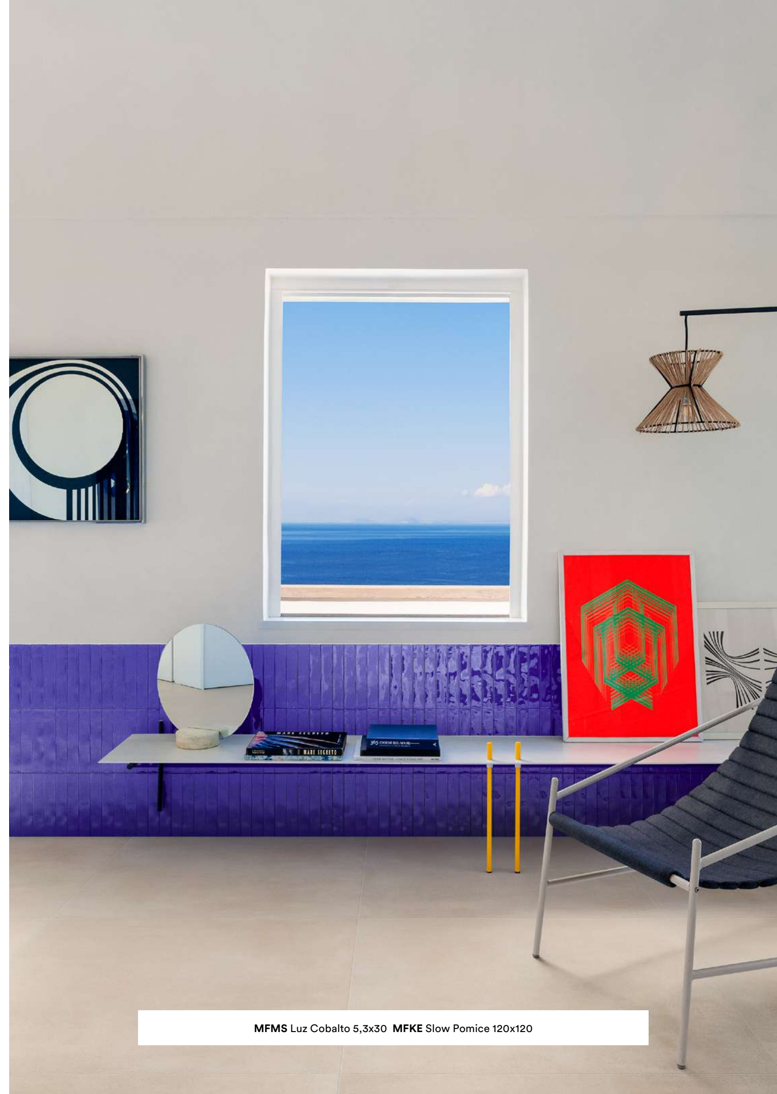
MFMS Luz Cobalto 5,3x30 MFKE Slow Pomice 120x120