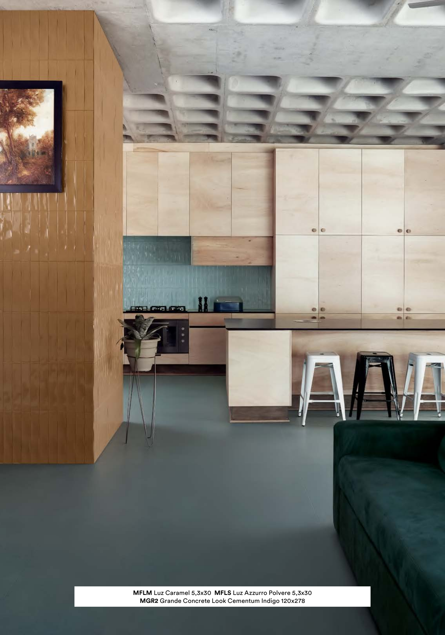
MFLM Luz Caramel 5,3x30 MFLS Luz Azzurro Polvere 5,3x30 MGR2 Grande Concrete Look Cementum Indigo 120x278