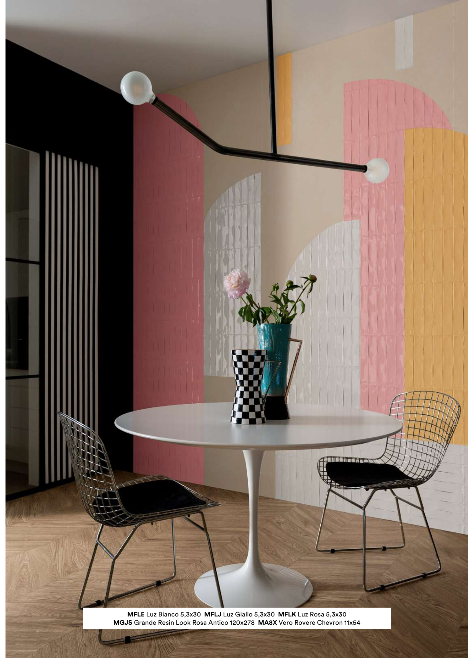
MFLE Luz Bianco 5,3x30 MFLJ Luz Giallo 5,3x30 MFLK Luz Rosa 5,3x30 MGJS Grande Resin Look Rosa Antico 120x278 MABX Vero Rovere Chevron 11x54