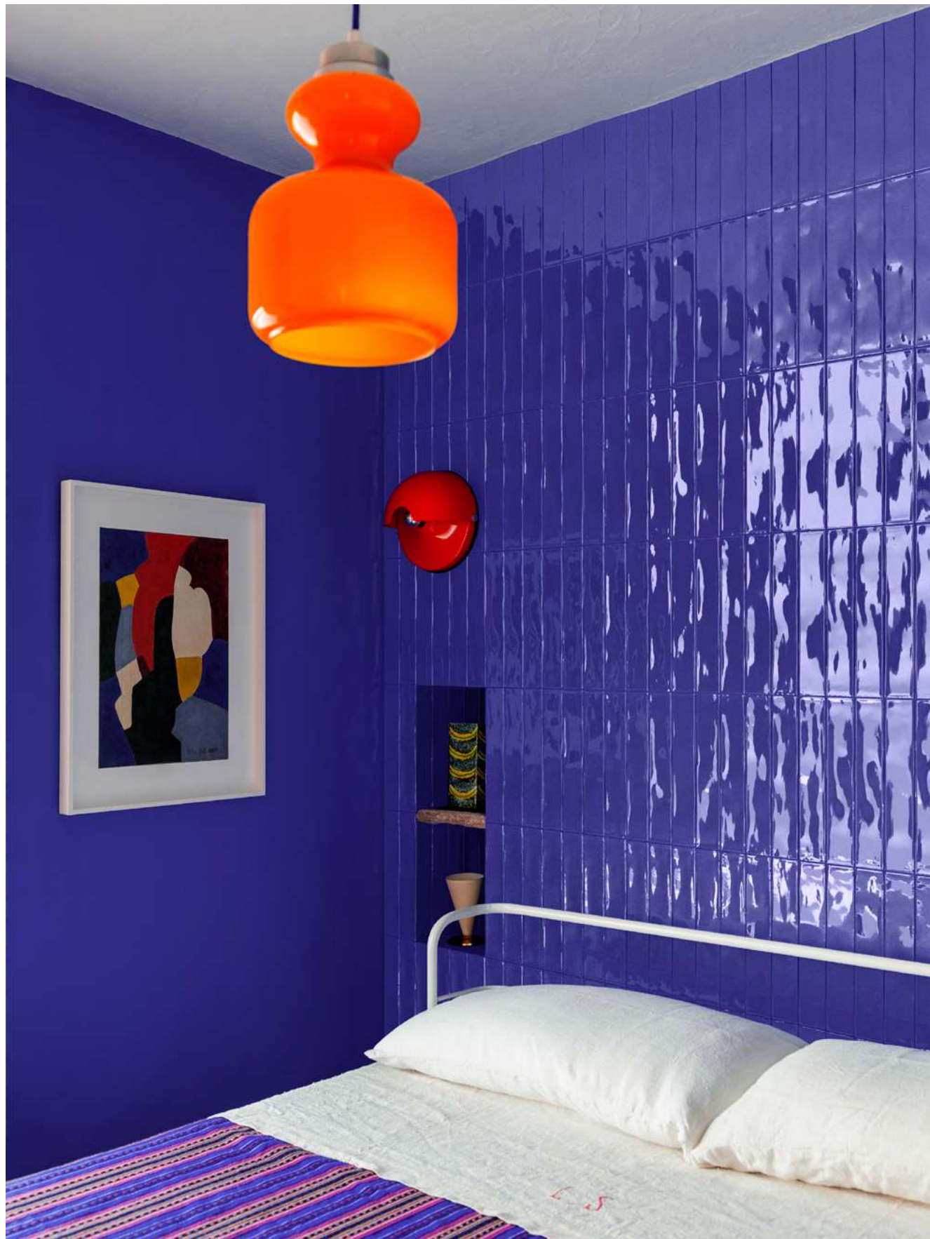
MFMS Luz Cobalto 5,3x30