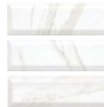
9034 Дорато белый грань 8,5x28,5 Dorato white chamfer