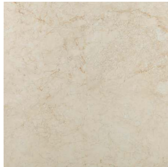
PEI 4 ● At. Mys Marfil 60x60 Rec. M28 017.840.0033.04105