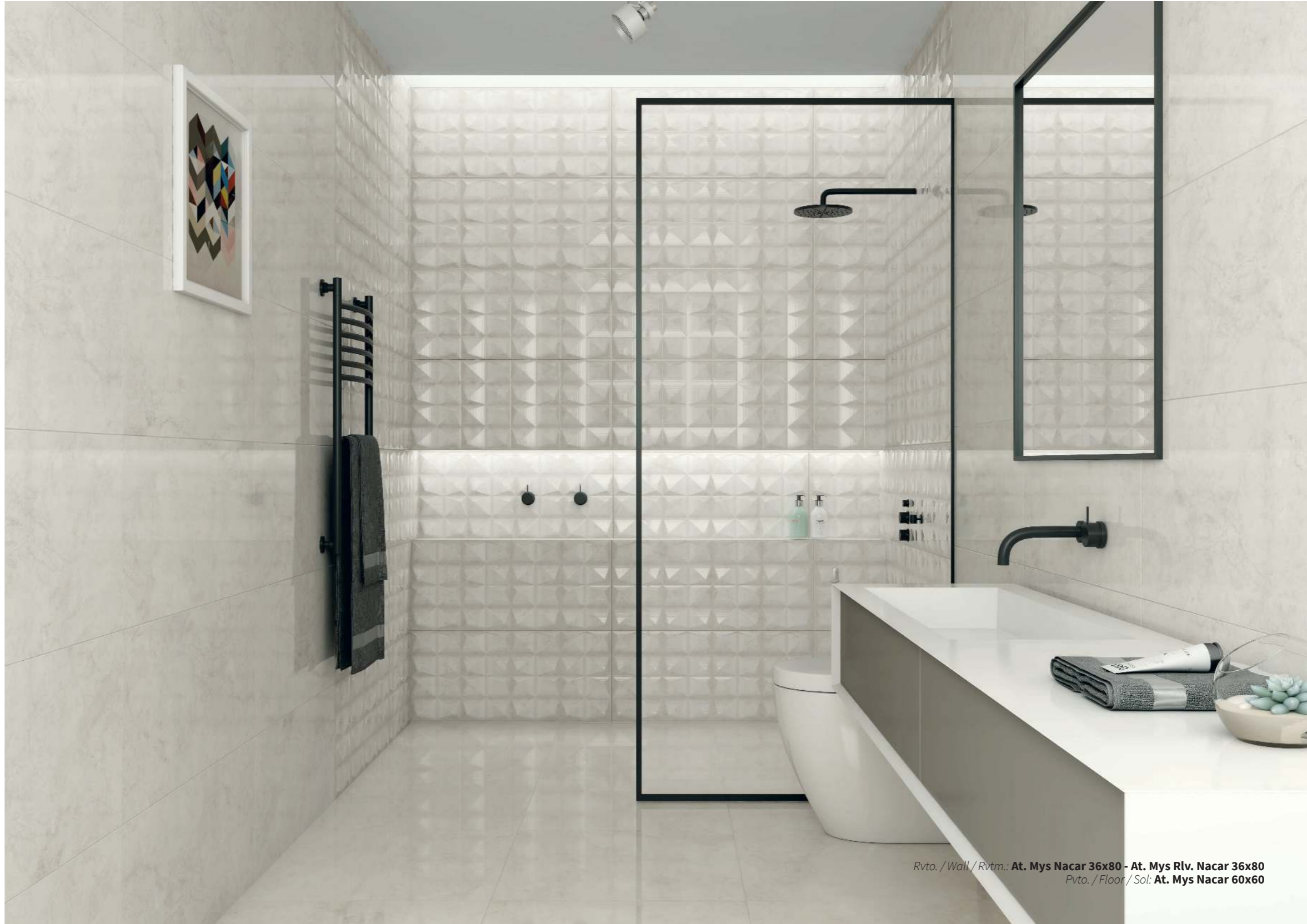
Rvto. / Wall / Rvtrm.: At. Mys Nacar 36x80 - At. Mys Rlv. Nacar 36x80 Pvto. / Floor / Sol: At. Mys Nacar 60x60