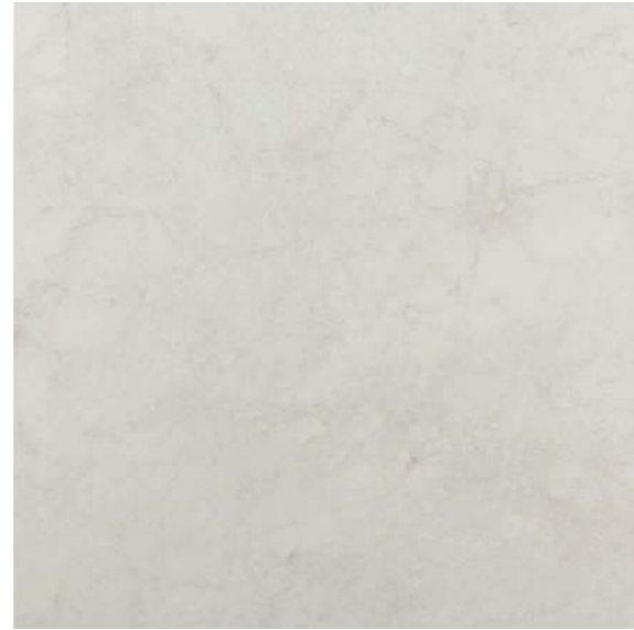
PEI 4 ● At. Mys Nacar 60x60 Rec. M28 017.840.0030.04105