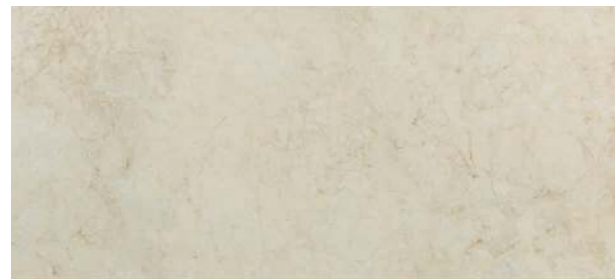
• At. Mys Marfil 36x80 M23 027.821.0033.04105