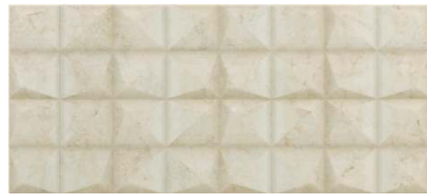
• At. Mys Rlv. Marfil 36x80 M23 027.821.0033.04099