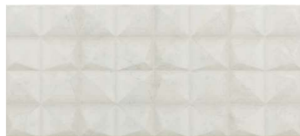
• At. Mys Rlv. Nacar 36x80 M23 027.821.0030.04099