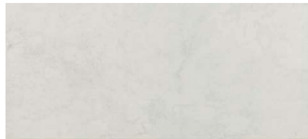
• At. Mys Nacar 36x80 M23 027.821.0030.04105