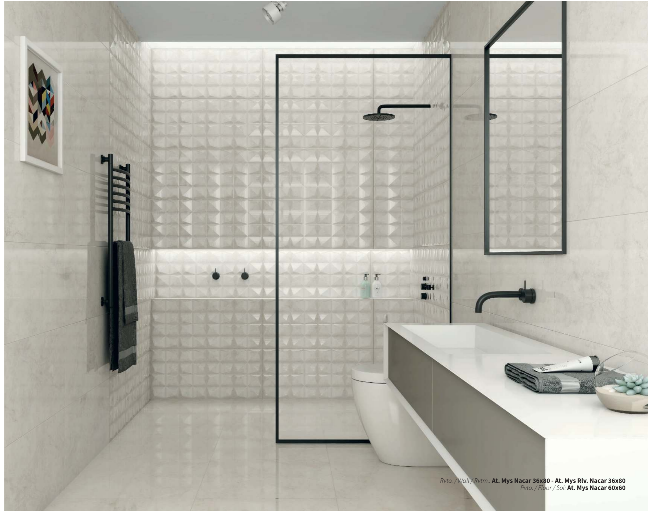
Rvto. / Wall / Rvtrm.: At. Mys Nacar 36x80 - At. Mys Rlv. Nacar 36x80 Pvto. / Floor / Sol: At. Mys Nacar 60x60

Pavimento Coordinado / Coordinated Flooring / Sol Coordinné: