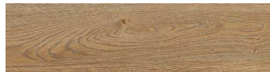
RC6Q 20x120 Rovere Rett RC6W 20x120 Rovere Grip Rett