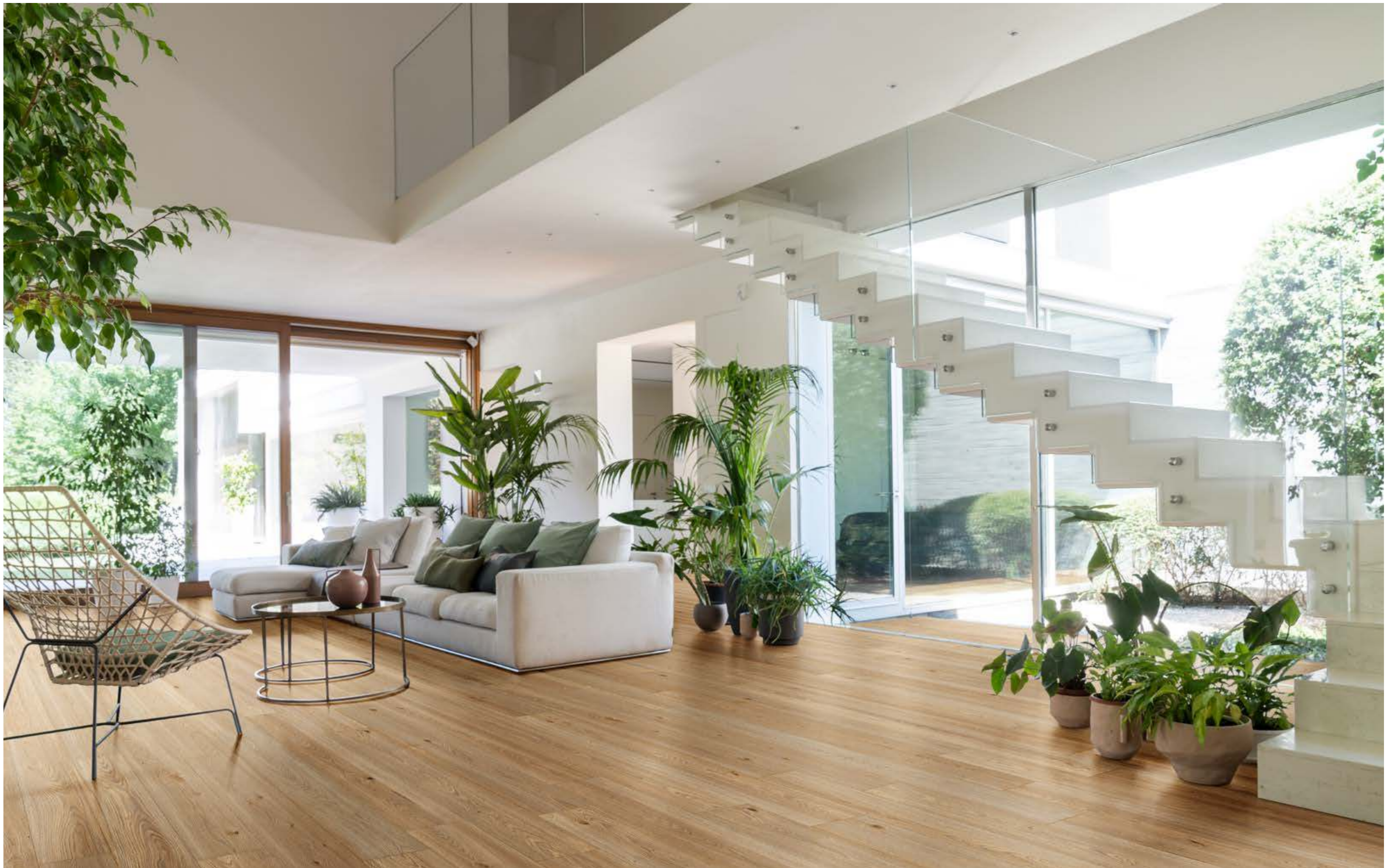
RC6Q Secret Rovere Rettificato 20x120 - 71/8" x 471/4" - RC6W Secret Rovere Grip Rettificato 20x120 - 71/8" x 471/4"