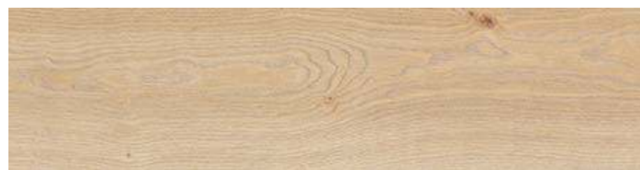
RC6M 20x120 Beige Rett RC6T 20x120 Beige Grip Rett