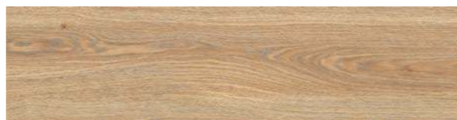
RC6P 20x120 Naturale Rett RC6V 20x120 Naturale Grip Rett