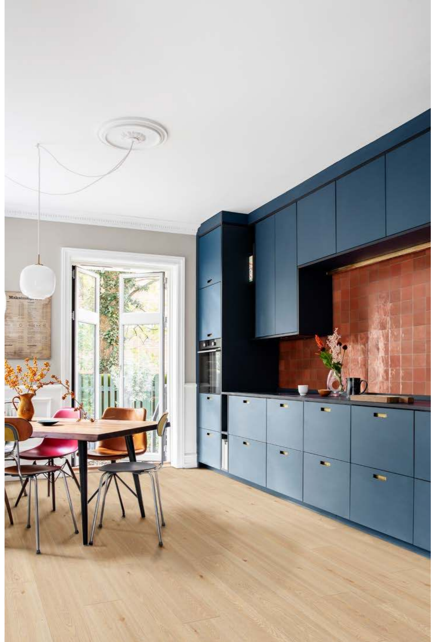
RC6M Secret Beige Rettificato 20x120 - 7 7/8 " x 47 1/4 " - R8G2 Mélange Bordeaux Glossy 10x10 - 3 15/16 " x 3 15/16 "