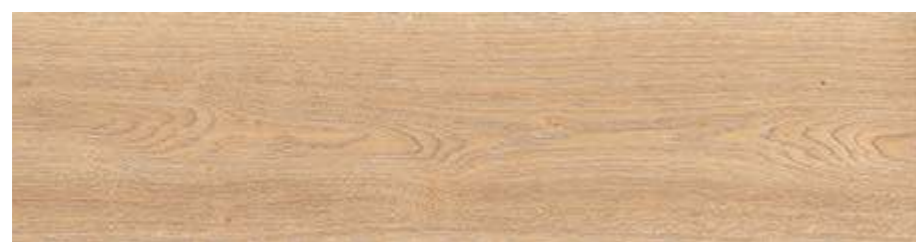
RC6N 20x120 Miele Rett RC6U 20x120 Miele Grip Rett