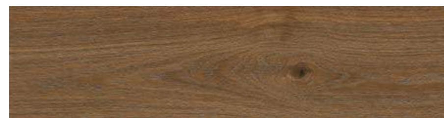
RC6R 20x120 Marrone Rett RC6X 20x120 Marrone Grip Rett