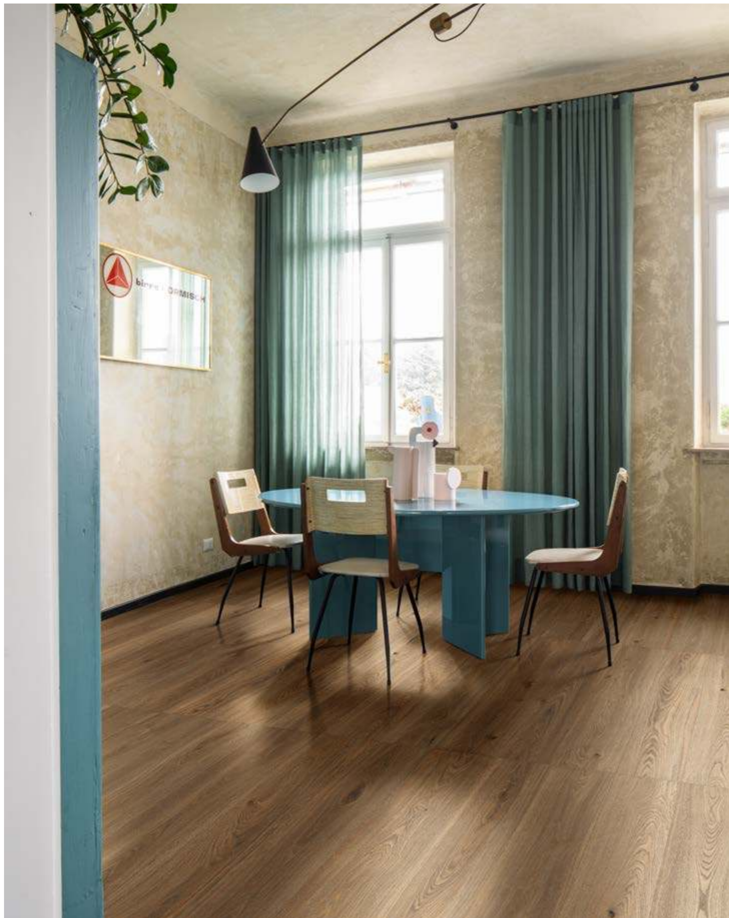
RC6R Secret Marrone Rettificato 20x120 - 7 7/8 " x 47 1/4 "