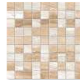
Capri Mosaico CP 01, CP 02 CP 11, CP 22 3x3 (1,2x1,2") 30x30 (12x12")

*производится для всех артикулов и типов поверхностей *available in all colors and surface