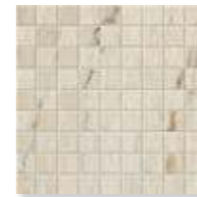
*Capri Mosaico 3x3 (1,2x1,2") 30x30 (12x12")