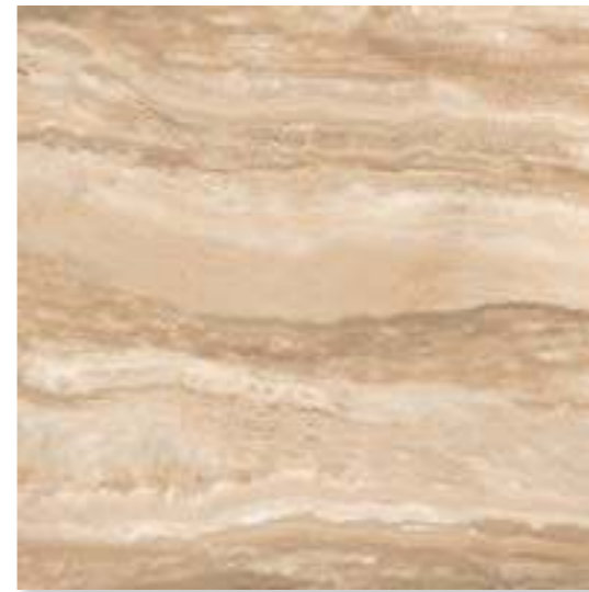
CP 22 40x40 (16x16") - 30x60 (12x24") - 60x60 (24x24")