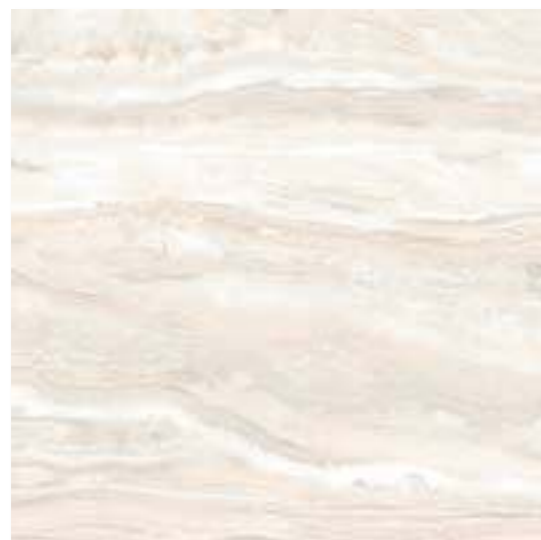
CP 11 40x40 (16x16") - 30x60 (12x24") - 60x60 (24x24")