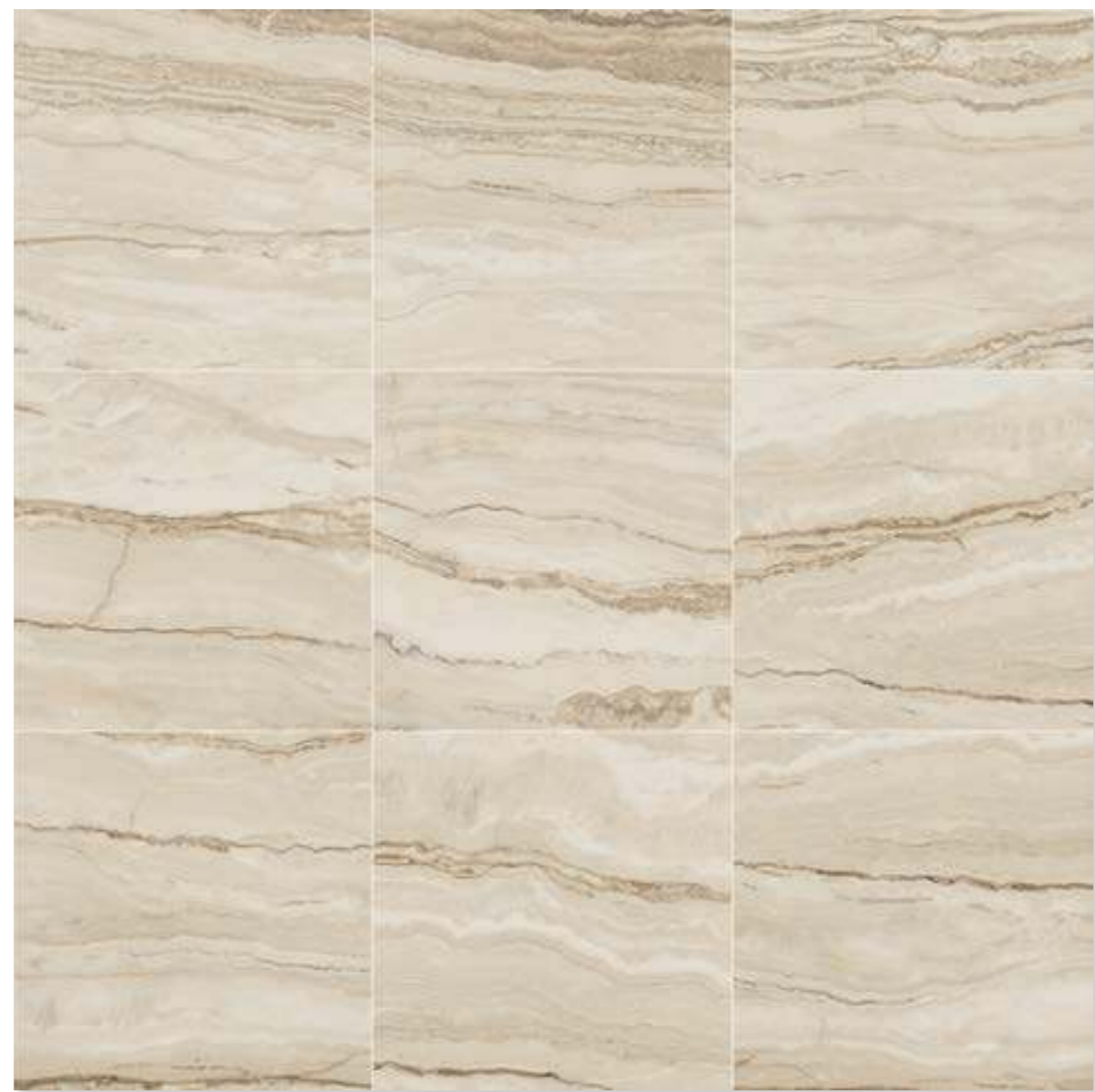
10 ГРАФИЧЕСКИХ РИСУНКОВ / 10 IMAGES