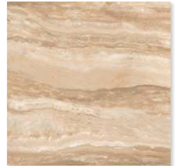
CP 22 40x40 (16x16") - 30x60 (12x24") - 60x60 (24x24")