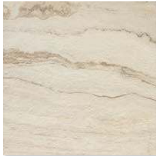
CP 01 40x40 (16x16") - 30x60 (12x24") - 60x60 (24x24")