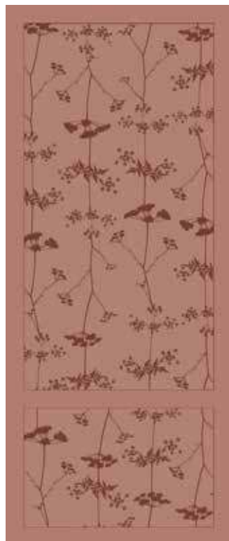
COTTO 50x120 - 19,6"x47,2" 00NEO125ZCR