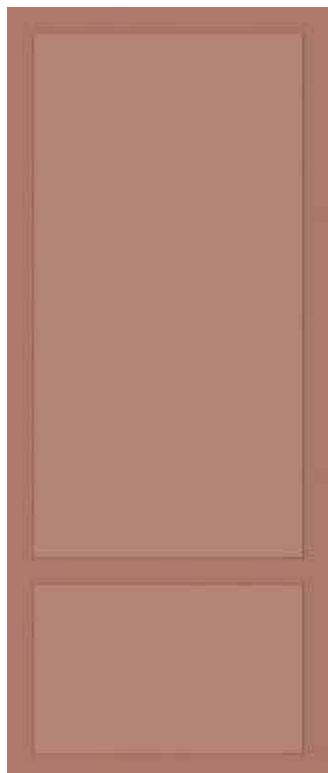
COTTO 50x120 - 19,6"x47,2" 00NEO12550R