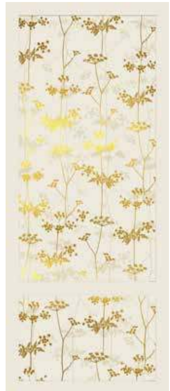
BEIGE 50x120 - 19,6"x47,2" 00NEO125DTBGR