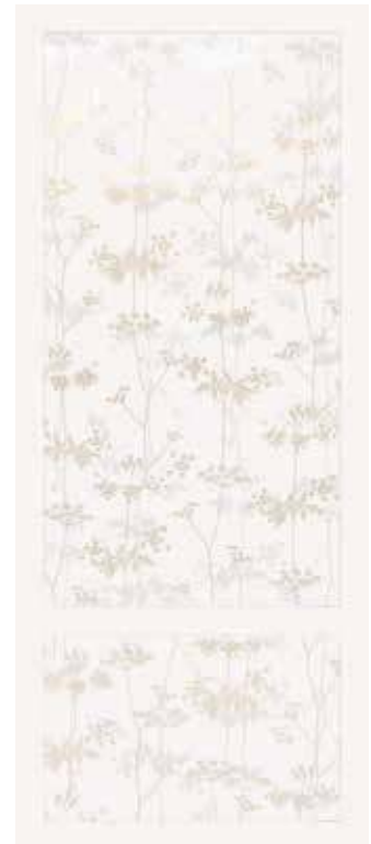
BIANCO 50x120 - 19,6"x47,2" 00NEO125DTBNR