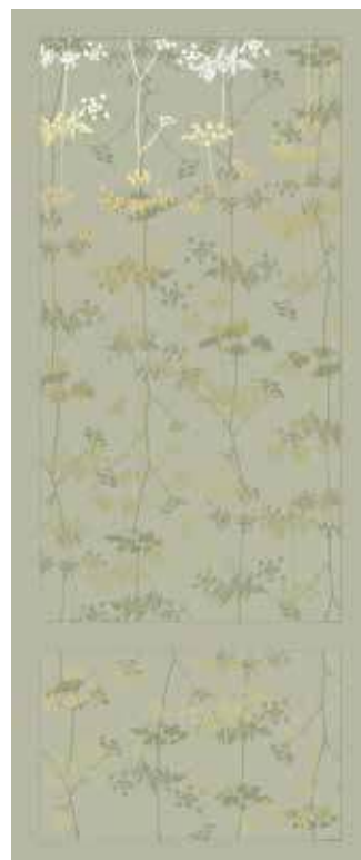
SALVIA 50x120 - 19,6"x47,2" 00NEO125DTSR