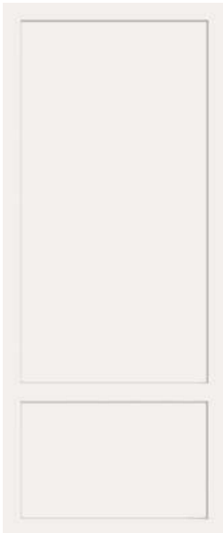
BIANCO 50x120 - 19,6"x47,2" 00NEO12510R