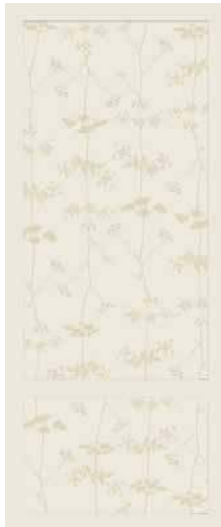
BEIGE 50x120 - 19,6"x47,2" 00NEO125ZBER