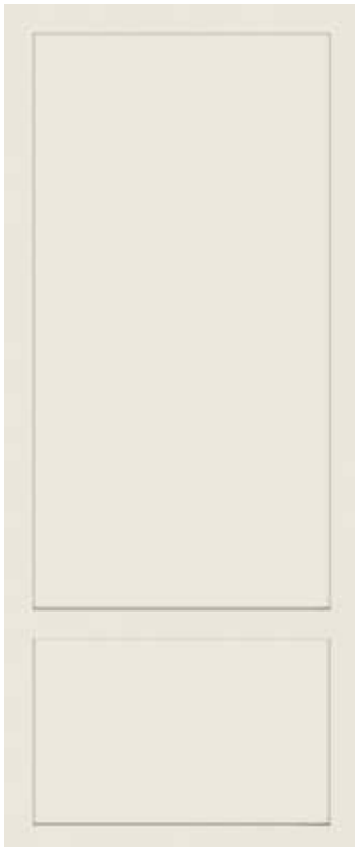
BEIGE 50x120 - 19,6"x47,2" 00NEO12520R