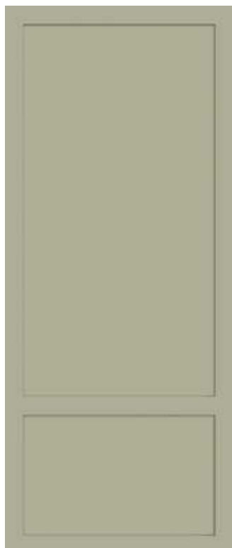
SALVIA 50x120 - 19,6"x47,2" 00NEO12590R