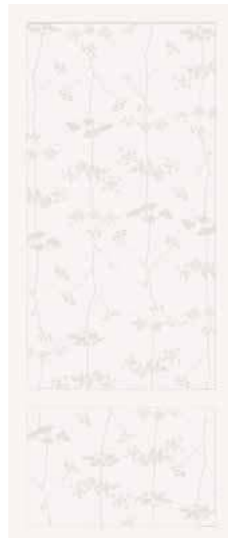
BIANCO 50x120 - 19,6"x47,2" 00NEO125ZBIR