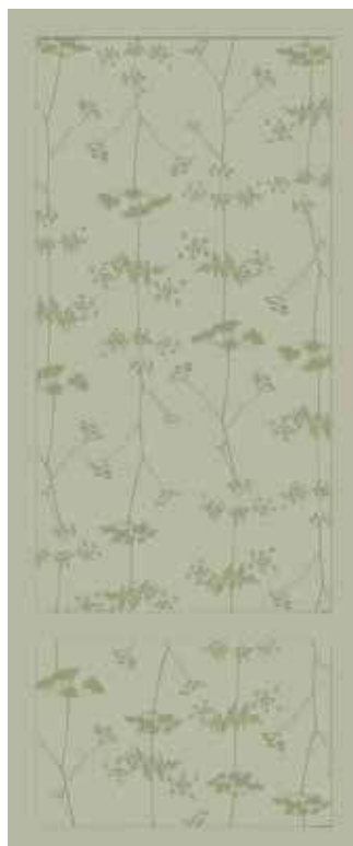
SALVIA 50x120 - 19,6"x47,2" 00NEO125ZSR