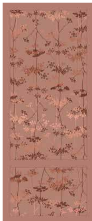
COTTO 50x120 - 19,6"x47,2" 00NEO125DTCTR