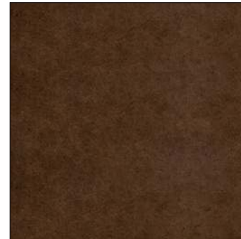
Idea Brown / Идея Бр ун