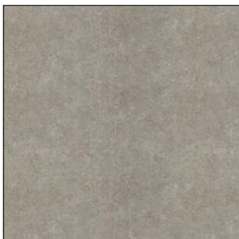
Idea Grey / Идея Грэй