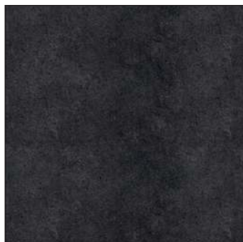
Idea Black / Идея Блэк