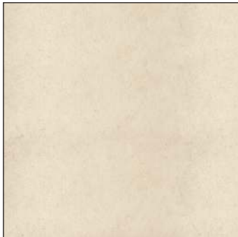
Idea White / Идея У йт