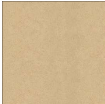
Idea Beige / Идея Беж