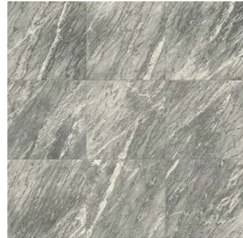
10 ГРАФИЧЕСКИХ РИСУНКОВ / 10 IMAGES