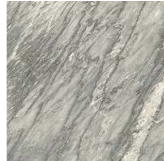
PA 01 40x40 (16x16") - 30x60 (12x24") - 60x60 (24x24")