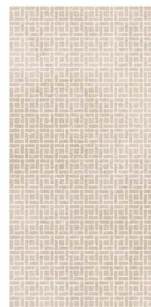
Micro Baiona GT4 10 x 14 CM