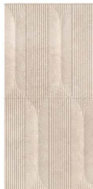
Neo Baiona GT4 30 x 60 CM