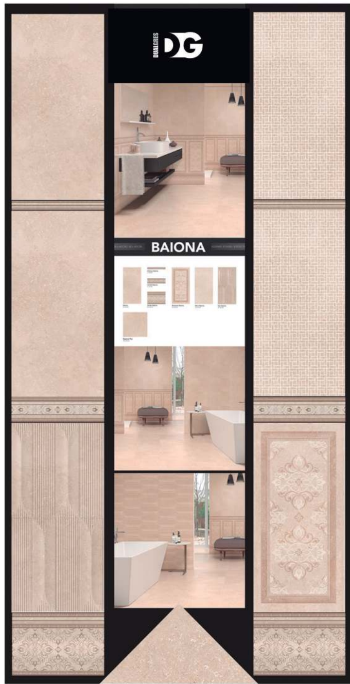
D19_006 · PANEL OTTO CLASSIC