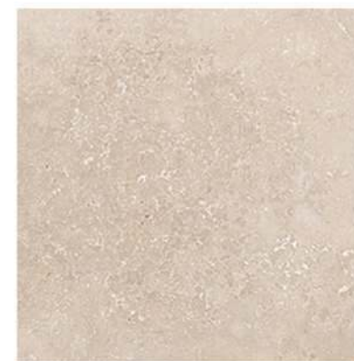
Pav. Baiona GT1 45 X 45 CM