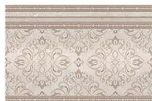
Zócalo Baiona D7 20 x 30 CM