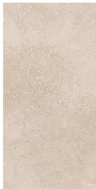
Baiona GT3 30 x 60 CM