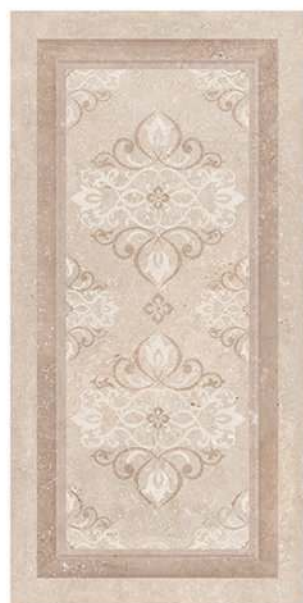
Boiserie Baiona GT4 30 x 60 CM