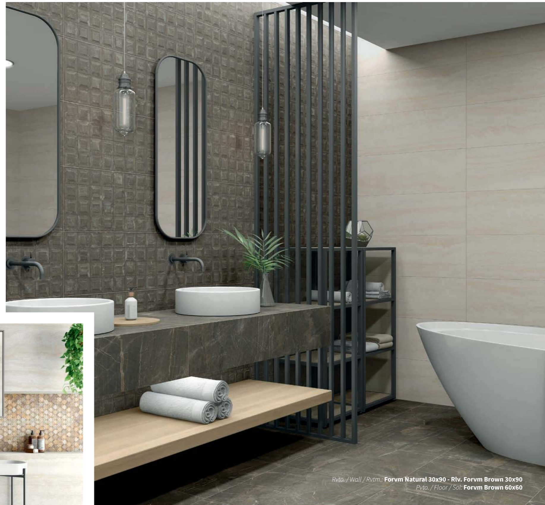
Rvto. / Wall / Rvtm.: Forvm Natural 30x90 - Rlv. Forvm Brown 30x90 Pvto. / Floor / Sol: Forvm Brown 60x60