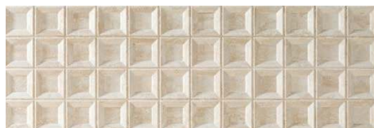
• Rlv. Forvm Natural 30x90 Rec. M48 031.872.0102.00139