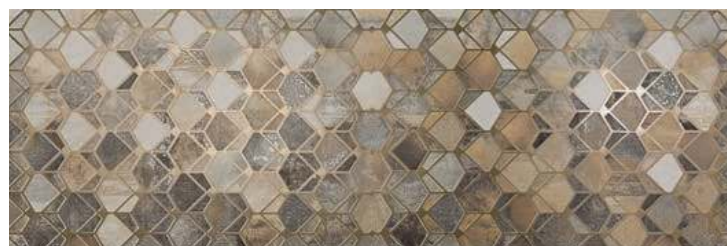
• Dec. Campania Natural 30x90 Rec. P142 032.896.0102.02407