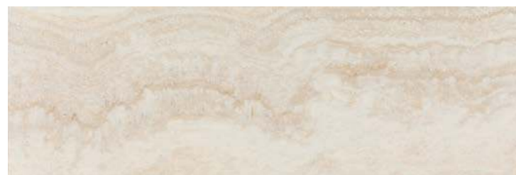
• Forvm Natural 30x90 Rec. M48 031.872.0102.00138