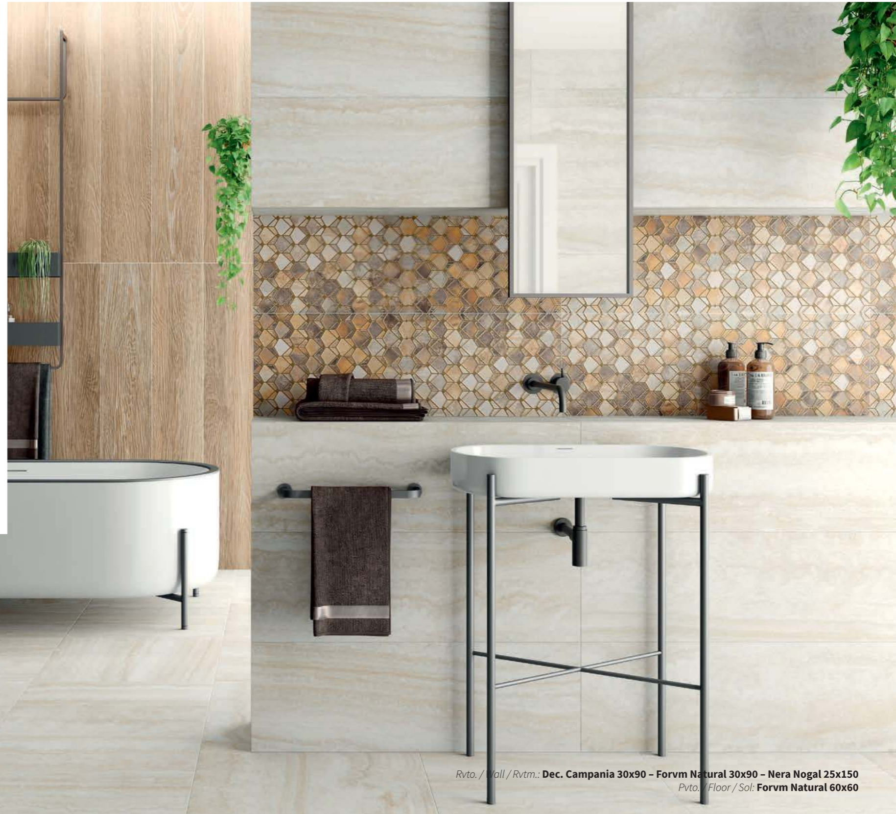
Rvto. / Wall / Rvtrm.: Dec. Campania 30x90 - Forvm Natural 30x90 - Nera Nogal 25x150 Pvto. / Floor / Sol: Forvm Natural 60x60