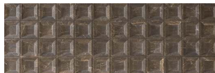
• Rlv. Forvm Brown 30x90 Rec. M48 031.872.0109.00139