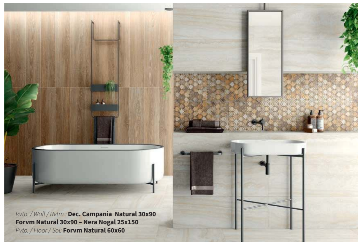
Rvto. / Wall / Rvtm.: Dec. Campania Natural 30x90 Forvm Natural 30x90 - Nera Nogal 25x150 Pvto. / Floor / Sol: Forvm Natural 60x60