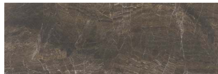
• Forvm Brown 30x90 Rec. M48 031.872.0109.00138