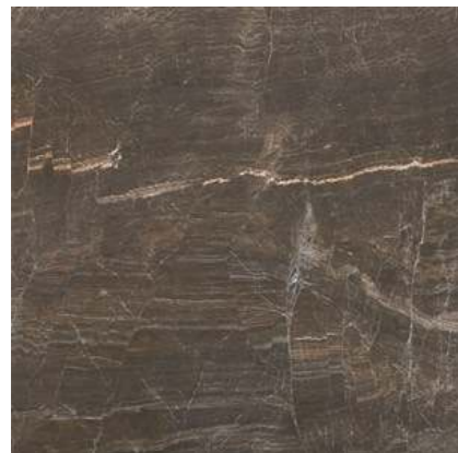
PEI 3 ● Forvm Brown 60x60 Rec. M48 017.840.0109.00138