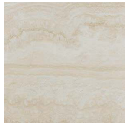
PEI 4 ● Forvm Natural 60x60 Rec. M48 017.840.0102.00138