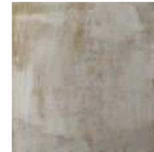
Memory Vison 44,5x44,5 · FZYT61K141 · M1330