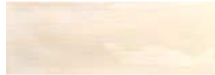
Arlette Beige · 21,4x61 · FZVT1GH041 · M1060