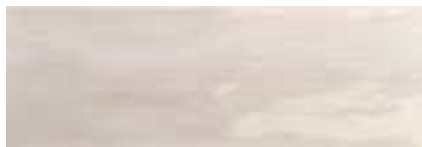
Arlette Gris · 21,4x61 · FZVT1GH021 · M1060