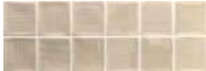
Mosaico Arlette Vison · 21,4x61 · FZV1TGH141 · M1180