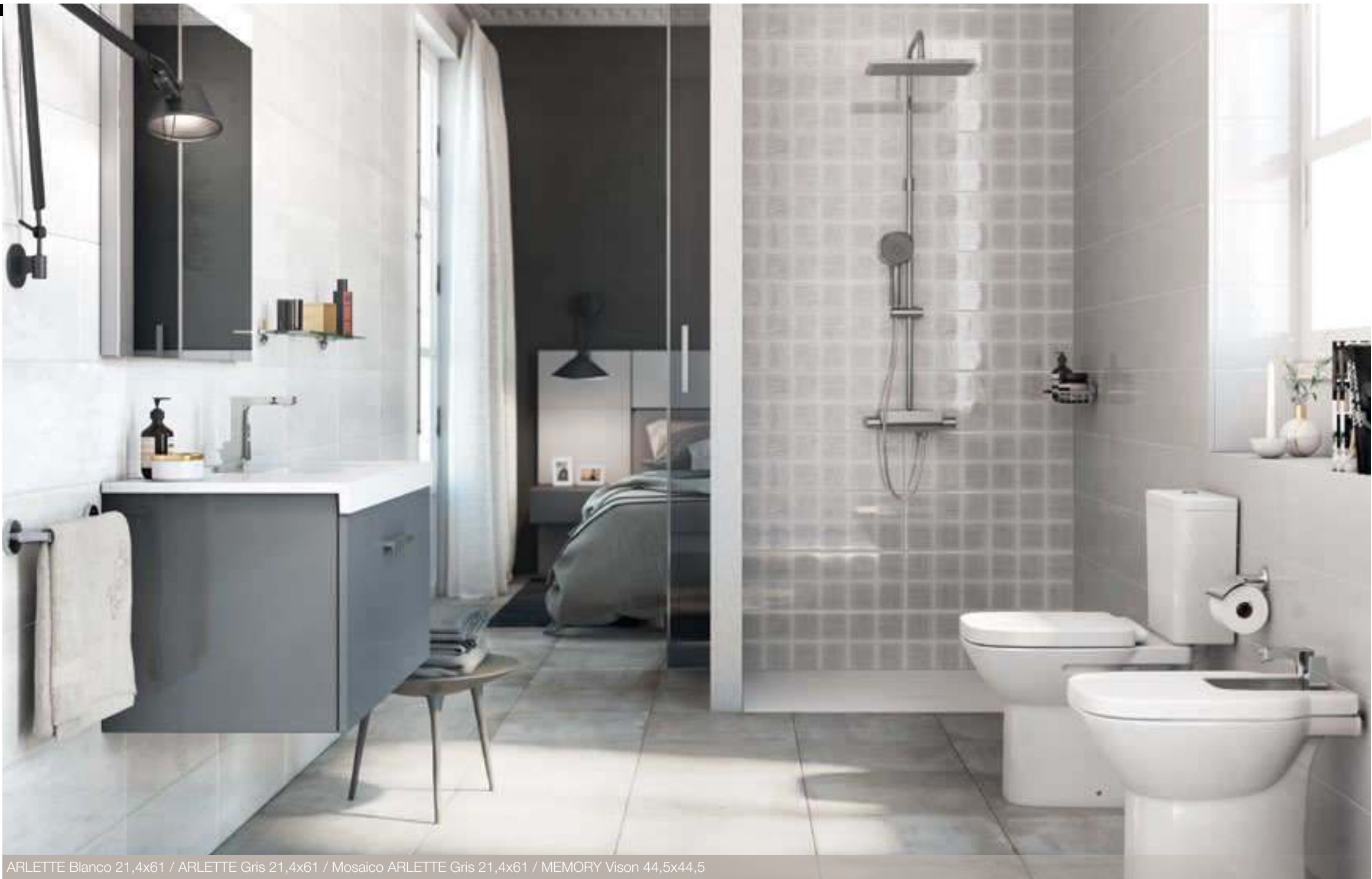
ARLETTE Blanco 21,4x61 / ARLETTE Gris 21,4x61 / Mosaico ARLETTE Gris 21,4x61 / MEMORY Vison 44,5x44,5