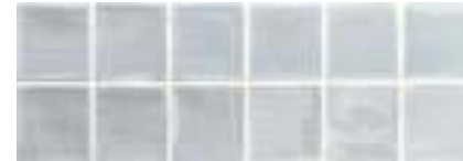
Mosaico Arlette Aqua · 21,4x61 · FZV1TGH651 · M1180