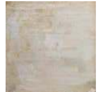
Memory Multicolor 44,5x44,5 · FZYT61KMC1 · M1330