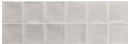
Mosaico Arlette Gris · 21,4x61 · FZV1TGH021 · M1180