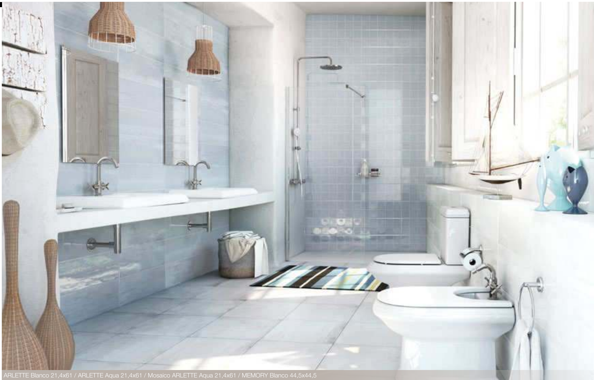
ARLETTE Blanco 21,4x61 / ARLETTE Aqua 21,4x61 / Mosaico ARLETTE Aqua 21,4x61 / MEMORY Blanco 44,5x44,5