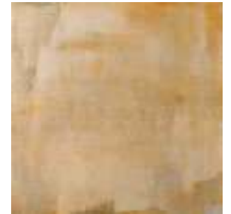
Memory Cotto 44,5x44,5 · FZYT61K501 · M1330