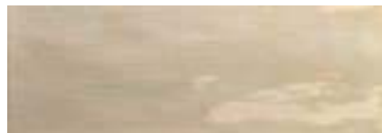
Arlette Vison · 21,4x61 · FZVT1GH141 · M1060