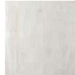
Memory Blanco 44,5x44,5 · FZYT61K011 · M1330