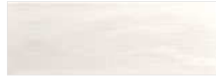
Arlette Blanco · 21,4x61 · FZVT1GH011 · M1060