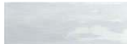
Arlette Aqua · 21,4x61 · FZVT1GH651 · M1090