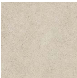
SG457500R Безана бежевый обрешной 50,2x50,2 Besana beige rectified