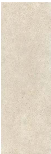
12138R Безана бежевый обрешной 25x75 Besana beige rectified