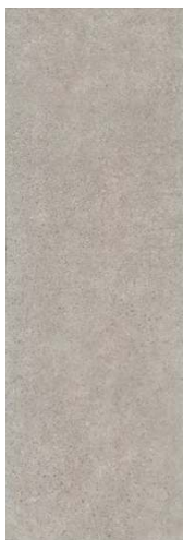
12137R Безана серый обрешной 25x75 Besana grey rectified