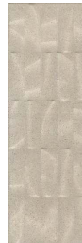
12153R Безана бежевый структура обрешной 25x75 Besana beige structured rectified