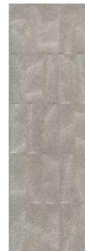
12152R Безана серый структура обрешной 25x75 Besana grey structured rectified