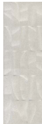
12151R Безана серый светлый структура обрешной 25x75 Besana light grey structured rectified