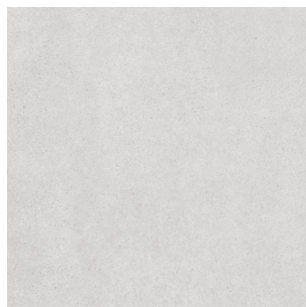
SG457900R Безана серый светлый обрешной 50,2x50,2 Besana light grey rectified