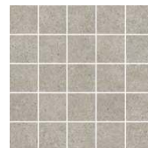
MM12137 Безана серый мозаичный 25x25 Besana grey mosaic