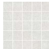
MM12136 Безана серый светлый мозаичный 25x25 Besana light grey mosaic