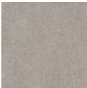
SG457600R Безана серый обрешной 50,2x50,2 Besana grey rectified