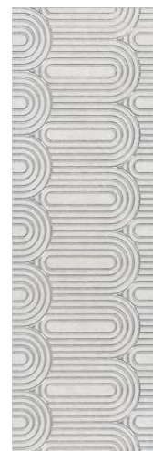
OPA201\12136R Безана серый светлый обрешной 25x75 Besana light grey rectified