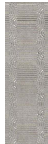
OPB201\12137R Безана серый обрешной 25x75 Besana grey rectified