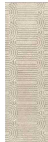
OPC201\12138R Безана бежевый обрешной 25x75 Besana beige rectified