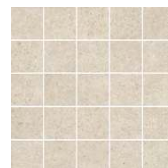
MM12138 Безана бежевый мозаичный 25x25 Besana beige mosaic