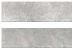
2912 Маттоне серый светлый 8,5x28,5 Mattone light grey