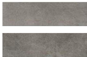
2911 Маттоне серый 8,5x28,5 Mattone grey