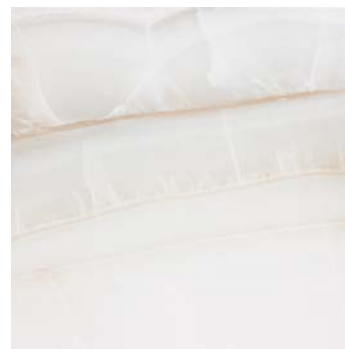
DNK610 DOREX 58,5x58,5 BEIGE B19