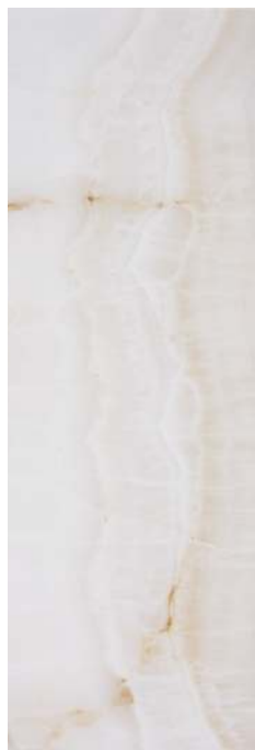
JKJ610 DOREX 40x120 B44 BEIGE