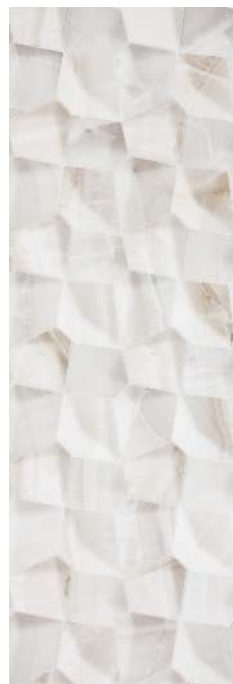
JKK990 VARY DOREX 40x120 B45 IRIS