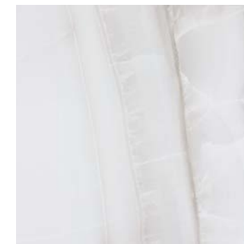
DNK710 DOREX 58,5x58,5 GRIS B19