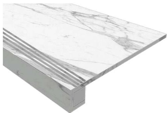
MN 01 white

33 × 120 cm / 14,5 × 120 13,2 × 48" / 5,7 × 48" неполированный natural