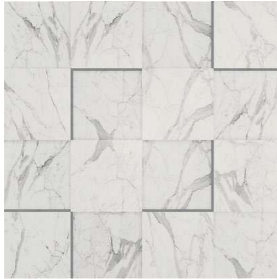
MN 01 white

30 × 30 неп./пол. natural/polished 12 × 12" неп./пол. natural/polished