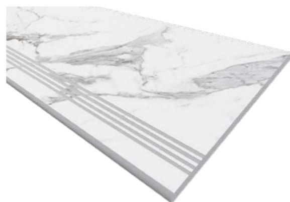
MN 01 white