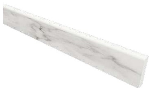
MN 01 white

7 × 60 cm / 3 × 24" неполированный natural полированный polished