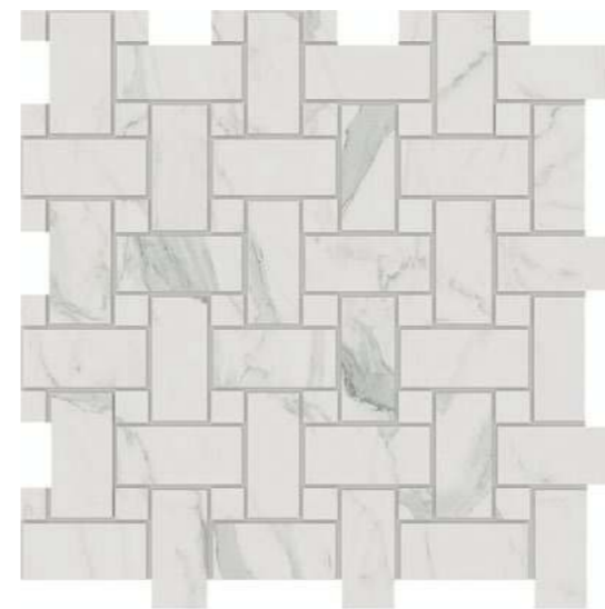
MN 01 white

33 × 33 неп./пол. natural/polished 13 × 13" полированный polished