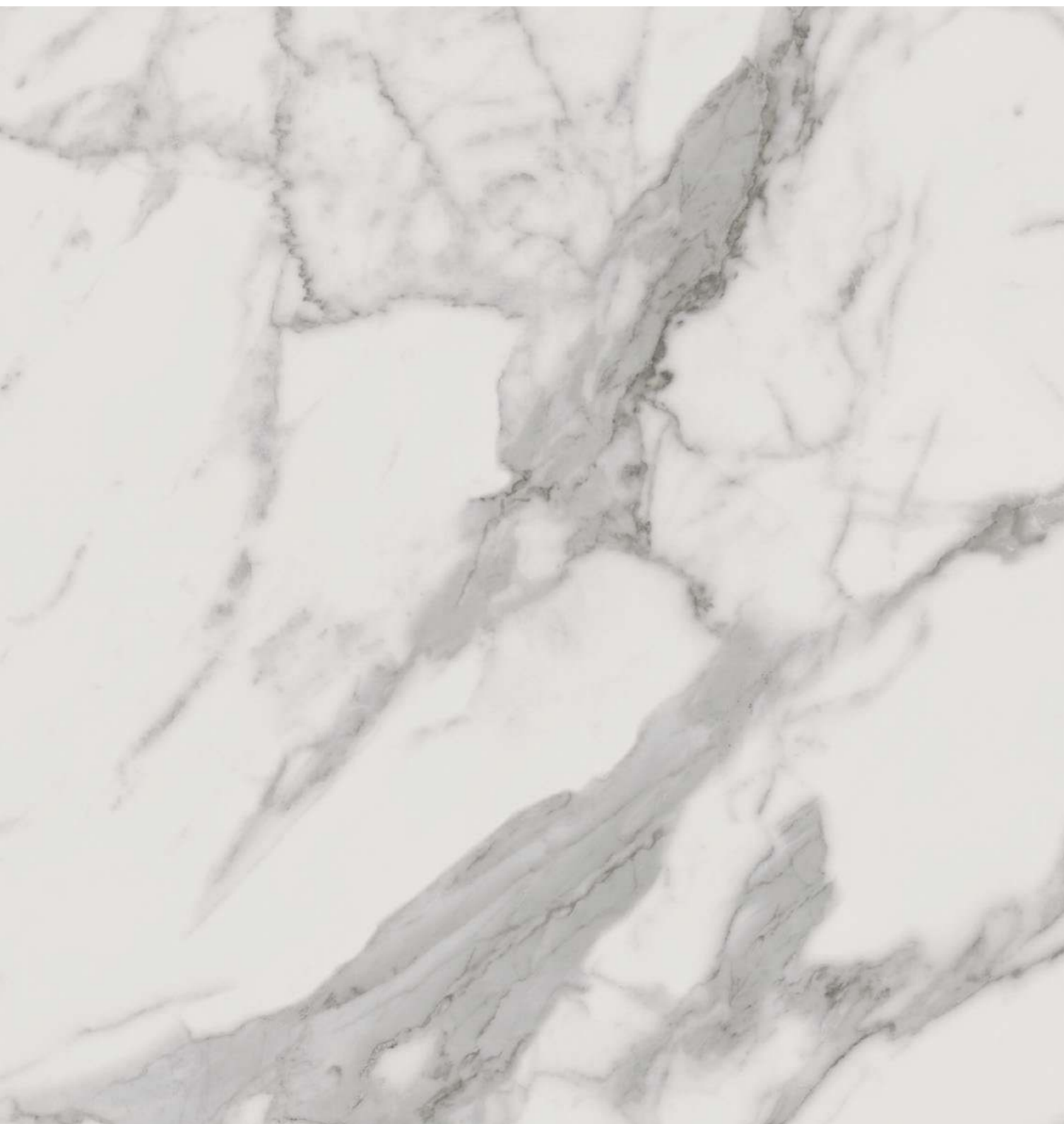
MN 01 white