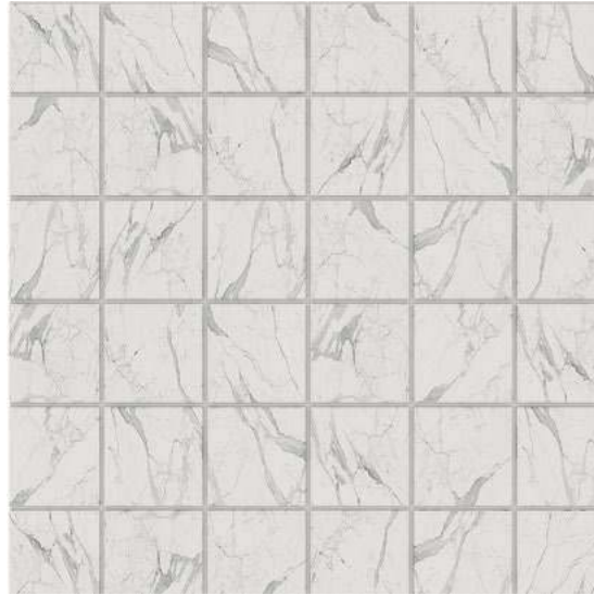
MN 01 white

30 × 30 неполированный natural 12 × 12" полированный polished