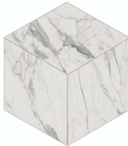
MN 01 white

29 × 25 неполированный natural 11,4 × 9,8" неполированный natural