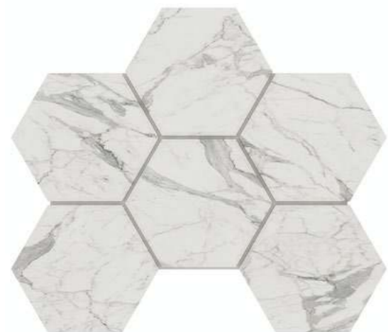
MN 01 white

25 × 28,5 неполированный natural 9,8 × 11,2" полированный polished