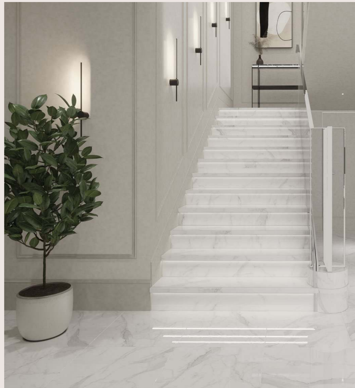
MONTIS. White Ступени (steps) white