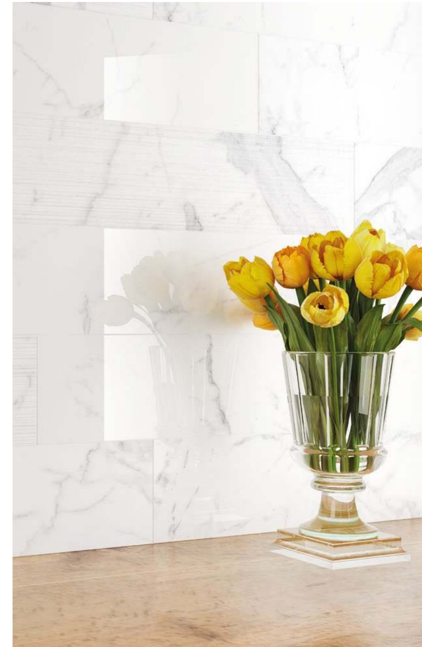
MONTIS. White stripes