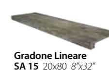
Gradone Lineare SA 15 20x80 8"x32"