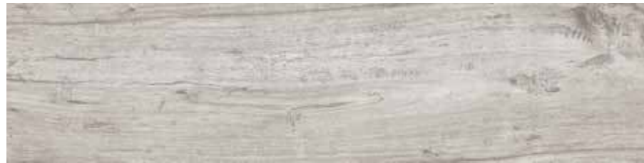
SA 5 20x80 8"x32" □077