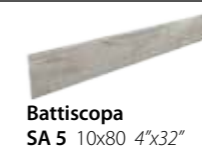
Battiscopa SA 5 10x80 4"x32"