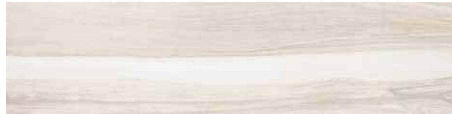
SA 1 20x80 8"x32" □077