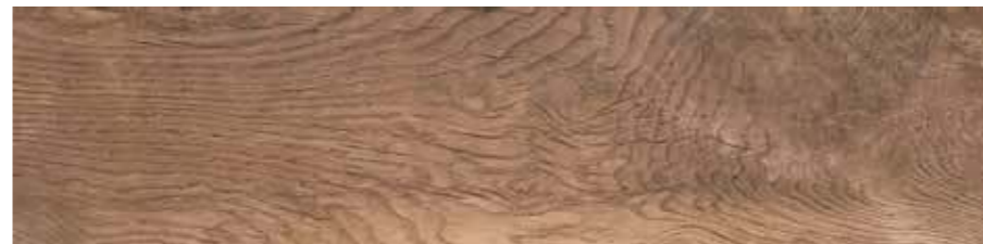
SA 9 20x80 8"x32" □077