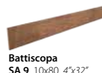
Battiscopa SA 9 10x80 4"x32"