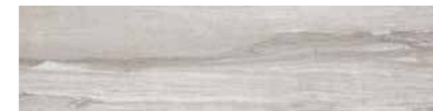
SA 5 Fast 20x80 - 8"x32" 103