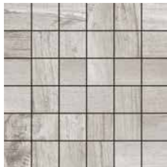
Mosaico / SA 5 30x30 12"x12" □206