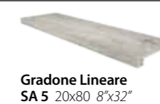
Gradone Lineare SA 5 20x80 8"x32"