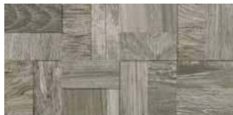
Fascia Tredi / SA 15 20x40 8"x16" □042