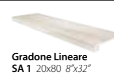
Gradone Lineare SA 1 20x80 8"x32"