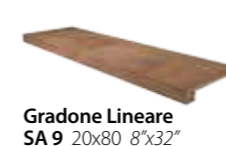
Gradone Lineare SA 9 20x80 8"x32"