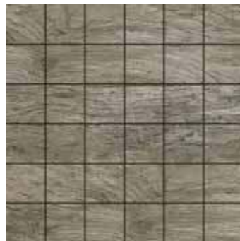
Mosaico / SA 15 30x30 12"x12" □206