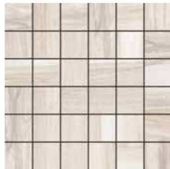
Mosaico / SA 1 30x30 12"x12" □206