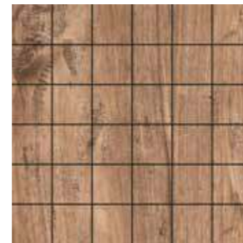
Mosaico / SA 9 30x30 12"x12" □206