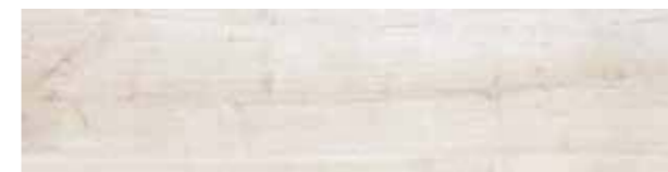
SA 1 Fast 20x80 - 8"x32" 103