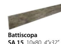
Battiscopa SA 15 10x80 4"x32"