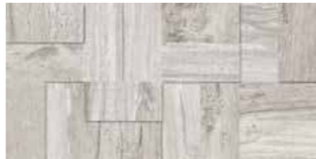
Fascia Tredi / SA 5 20x40 8"x16" □042