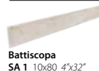
Battiscopa SA 1 10x80 4"x32"

Pezzi speciali (da incollare) • Special pieces (to be glued on) • Formteile (zu verkleben) • Pièces spéciales (à coller)