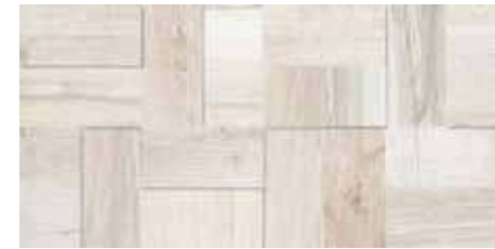
Fascia Tredi / SA 1 20x40 8"x16" □042