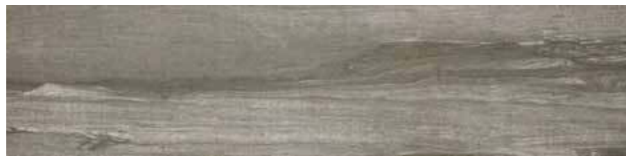
SA 15 20x80 8"x32" □077