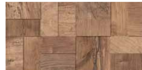
Fascia Tredi / SA 9 20x40 8"x16" □042