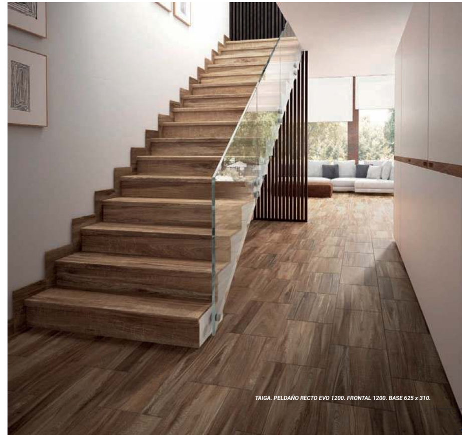
TAIGA. PELDAÑO RECTO EVO 1200. FRONTAL 1200. BASE 625 x 310.