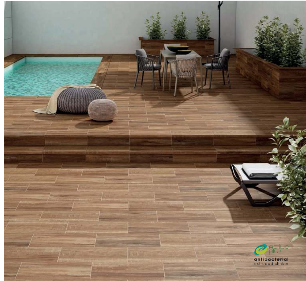
TAIGA. BASE 625 x 310. PELDAÑO RECTO EVO 625. FRONTAL 625 x 150.

active plus antibacterial extruded clinker