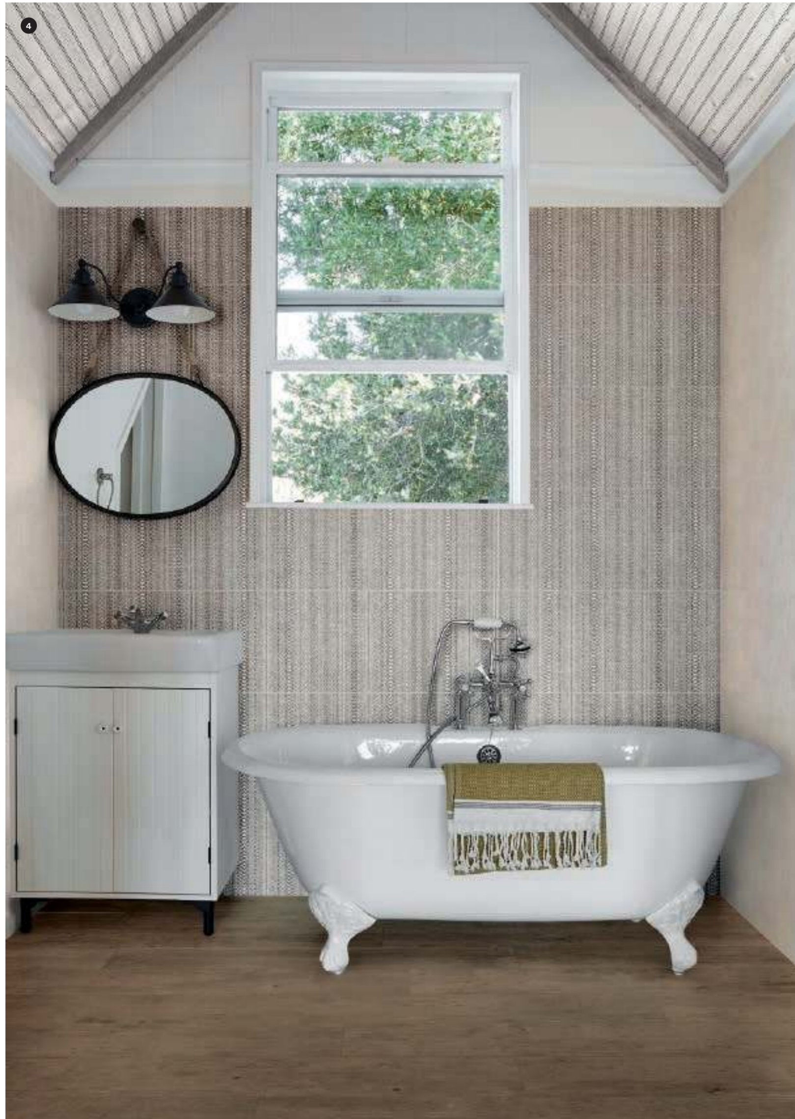
4 MQUT Fabric Cotton 40x120 MEIM Decoro Canvas 40x120 MZUD Treverkdear Brown Rett. 25x150