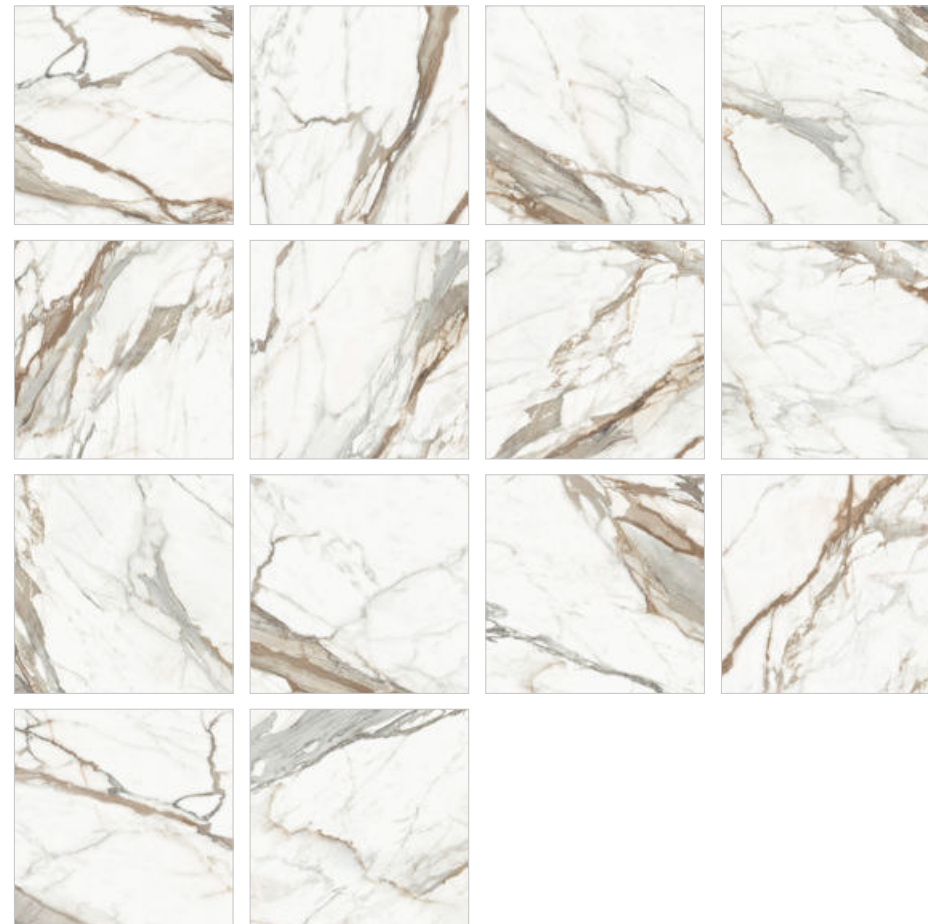
Calacatta Premium D60209M Керамогранит 600×600×9,5 мм