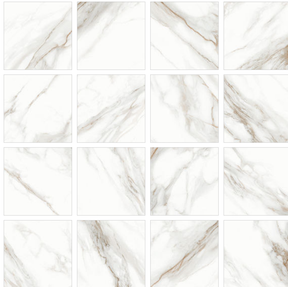
Calacatta Andrea D60210M Керамогранит 600×600×9,5 мм