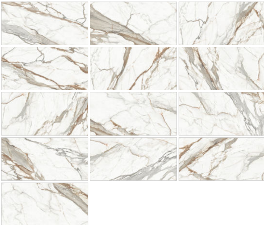
Calacatta Premium D120209M Керамогранит 600×1200×9,5 мм