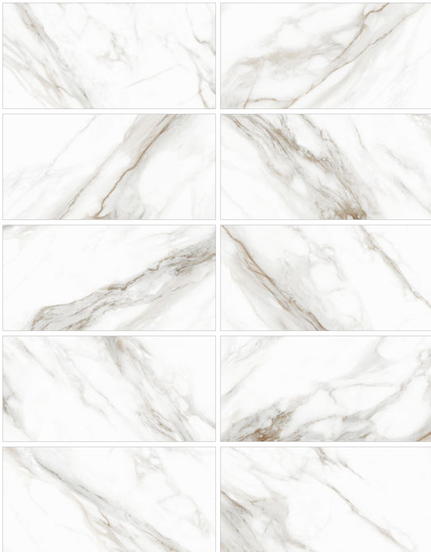
Calacatta Andrea D120210M Керамогранит 600×1200×9,5 мм