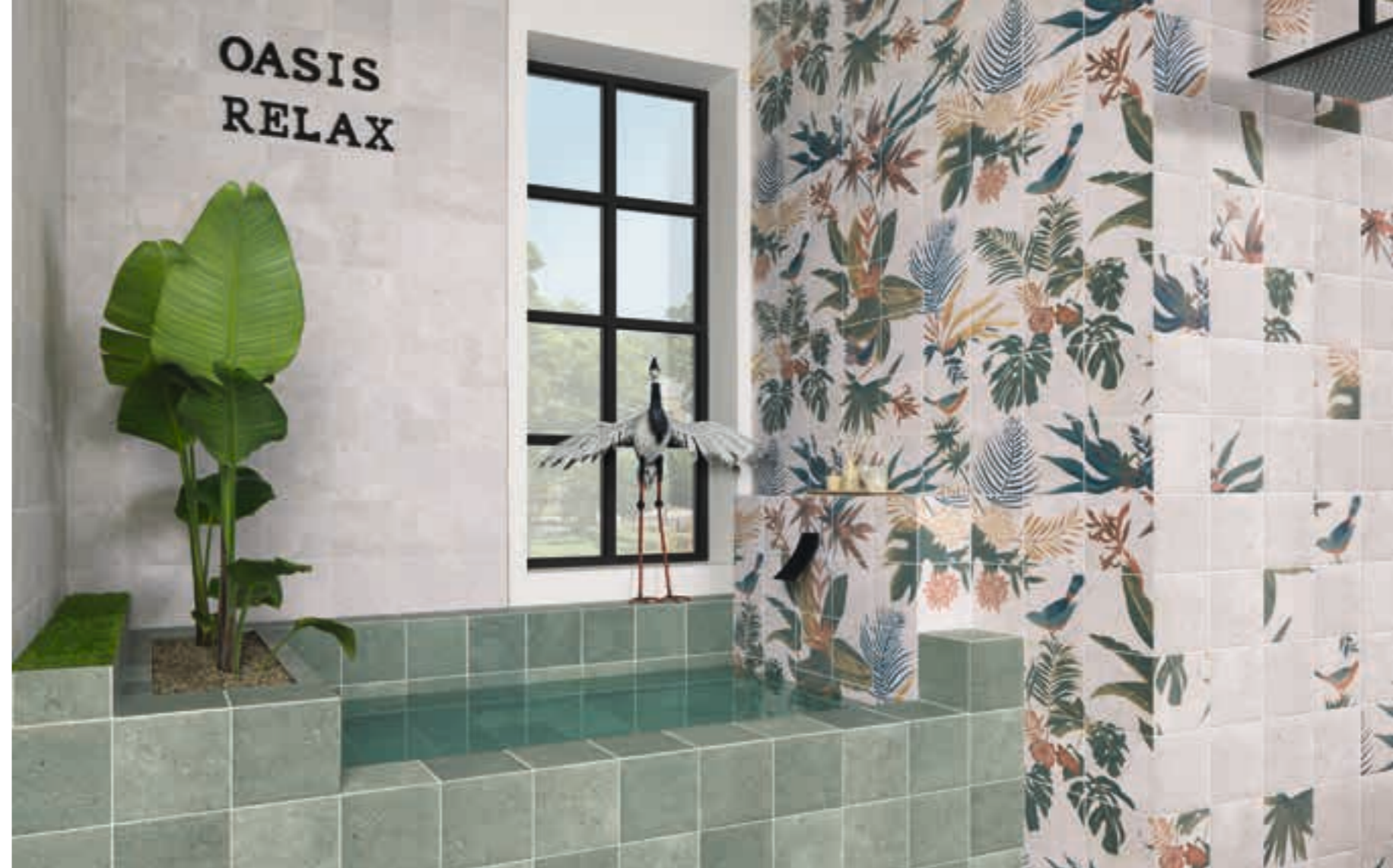
White Bali Stone 20x20 · 8"x8" · Green Bali Stone 20x20 · 8"x8" · Decor Samui 20x20 · 8"x8" · Mural Samui 120x120 formado por 36 piezas de 20x20 · 48"x48" formed by 36 pieces of 8"x8"