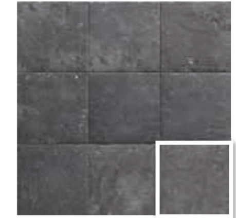
LAVA BALI STONE 20x20 (M 280) 8"x8"