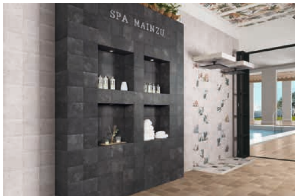
White Bali Stone 20x20 · 8"x8" · Lava Bali Stone 20x20 · 8"x8" Decor Samui 20x20 · 8"x8" · Sand Bali Stone 20x20 · 8"x8"