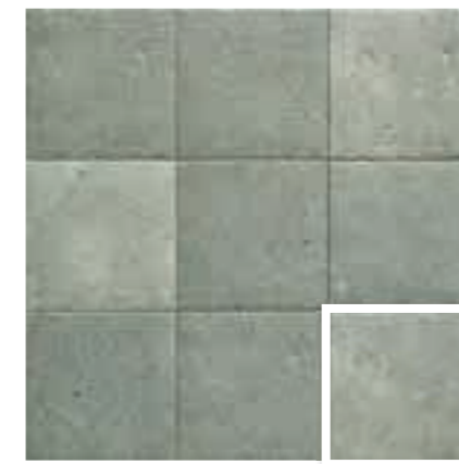
GREEN BALI STONE 20x20 (M 280) 8"x8"