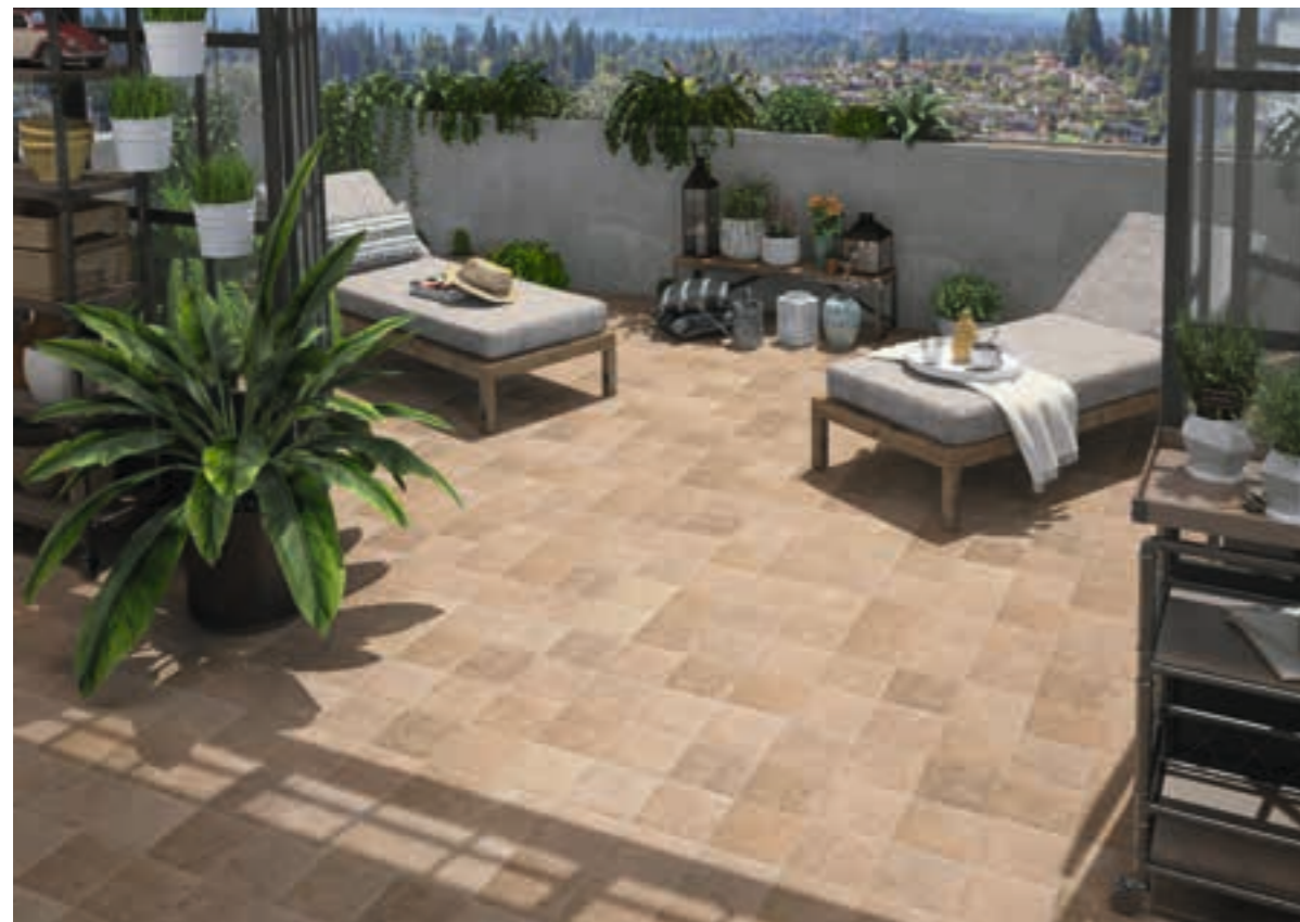
90 Sand Bali Stone 20x20 · 8"x8"