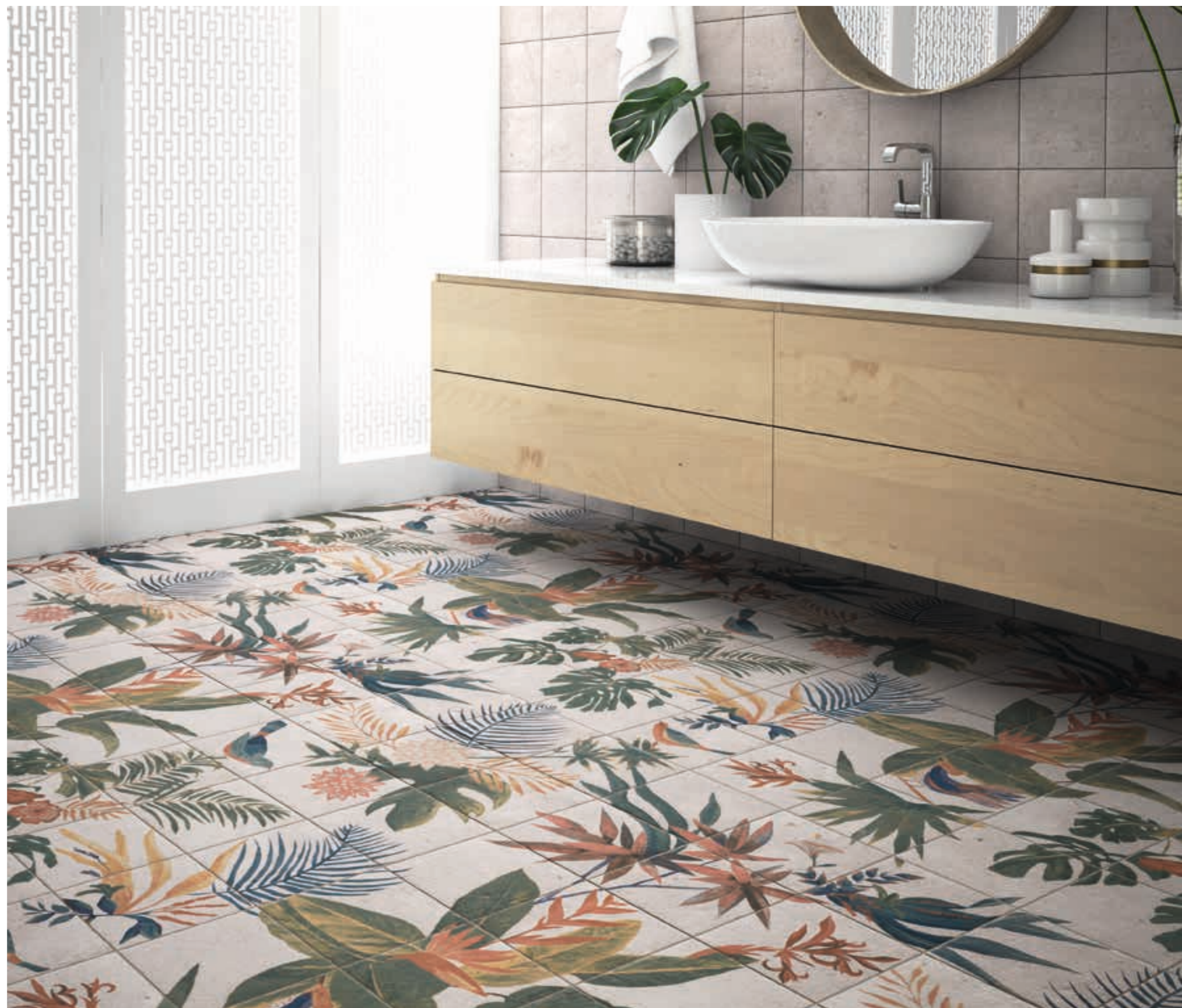
White Bali Stone 20x20 · 8"x8" · Mural Samui 120x120 formado por 36 piezas de 20x20 · 48"x48" formed by 36 pieces of 8"x8" 87