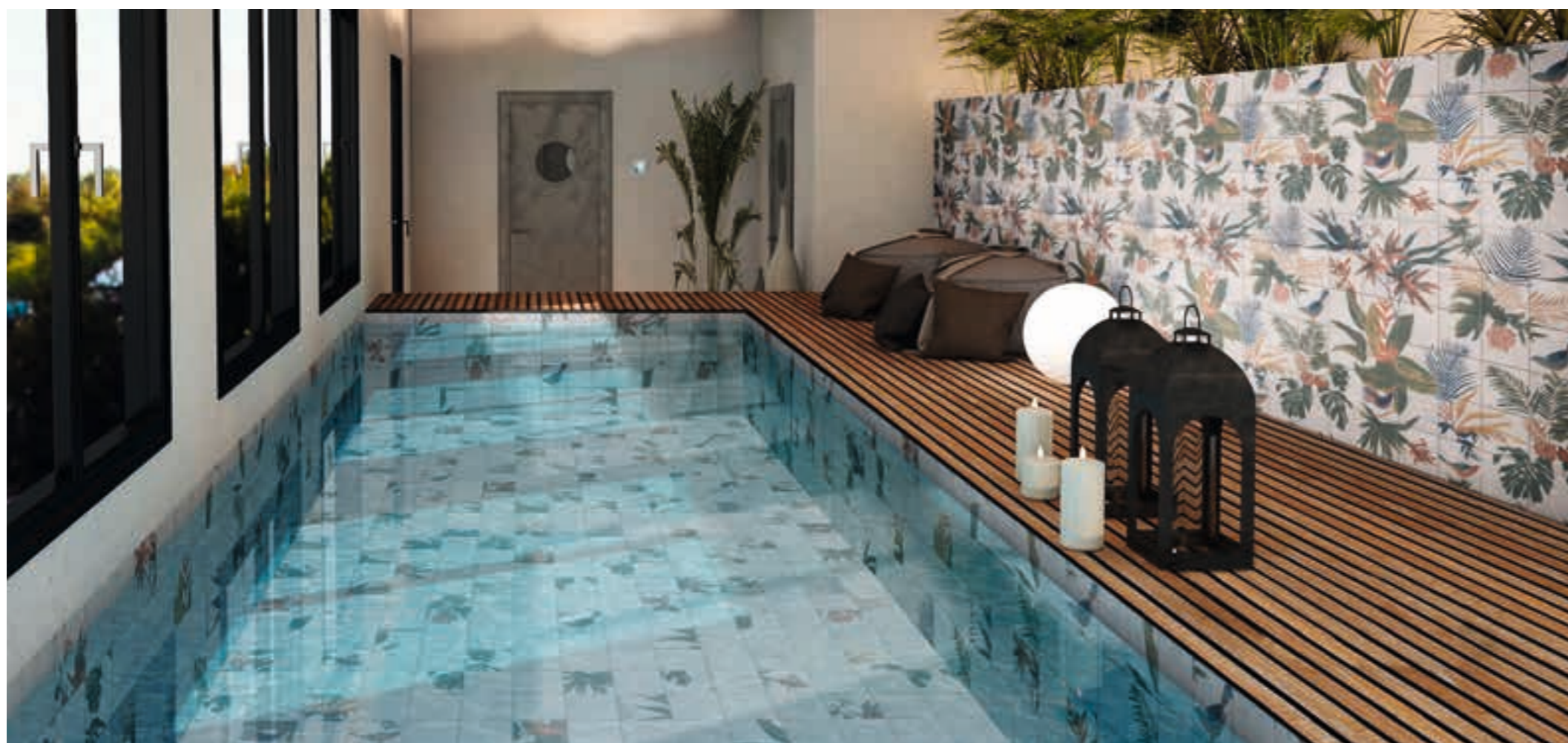
88 White Bali Stone 20x20 · 8"x8" · Decor Samui 20x20 · 8"x8" · Mural Samui 120x120 formado por 36 piezas de 20x20 · 48"x48" formed by 36 pieces of 8"x8"