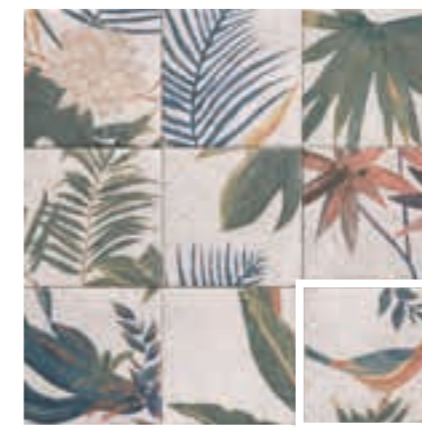
DECOR SAMUI 20x20 (M 280) 8"x8"