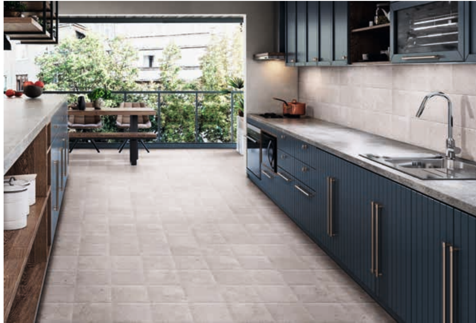
White Bali Stone 20x20 · 8"x8"