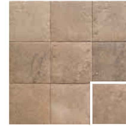
SAND BALI STONE 20x20 (M 280) 8"x8"