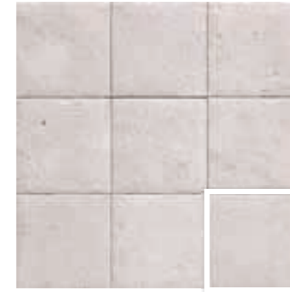
WHITE BALI STONE 20x20 (M 280) 8"x8"

RES. A LOS QUÍMICOS RESISTANT TO CHEMICALS GA-GLA-GHA