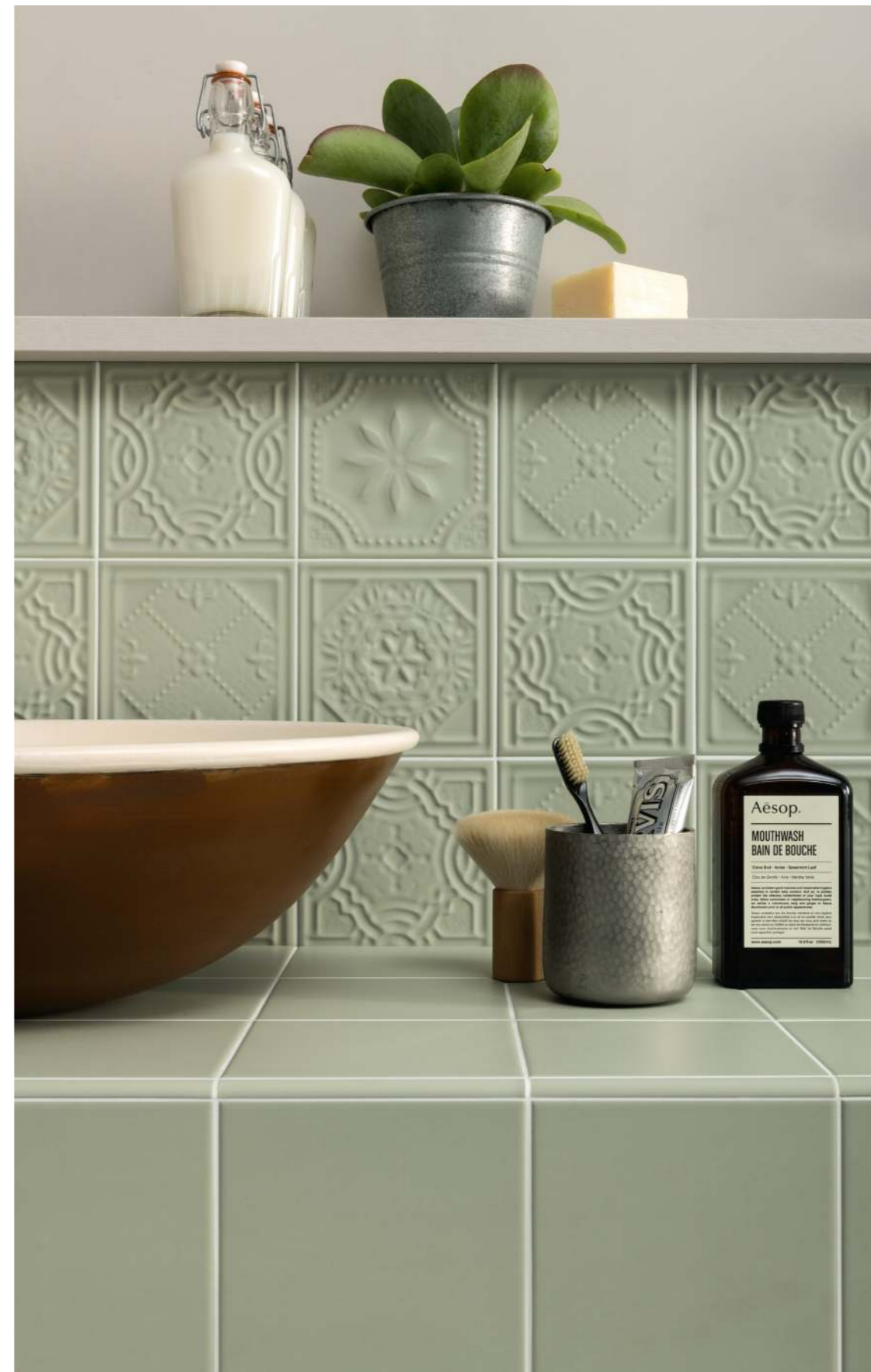
15X15 / 5,9"X5,9" SOFFIO SALVIA - STUBE - COPRIFILO 1X15 / 0,4"X5,9"