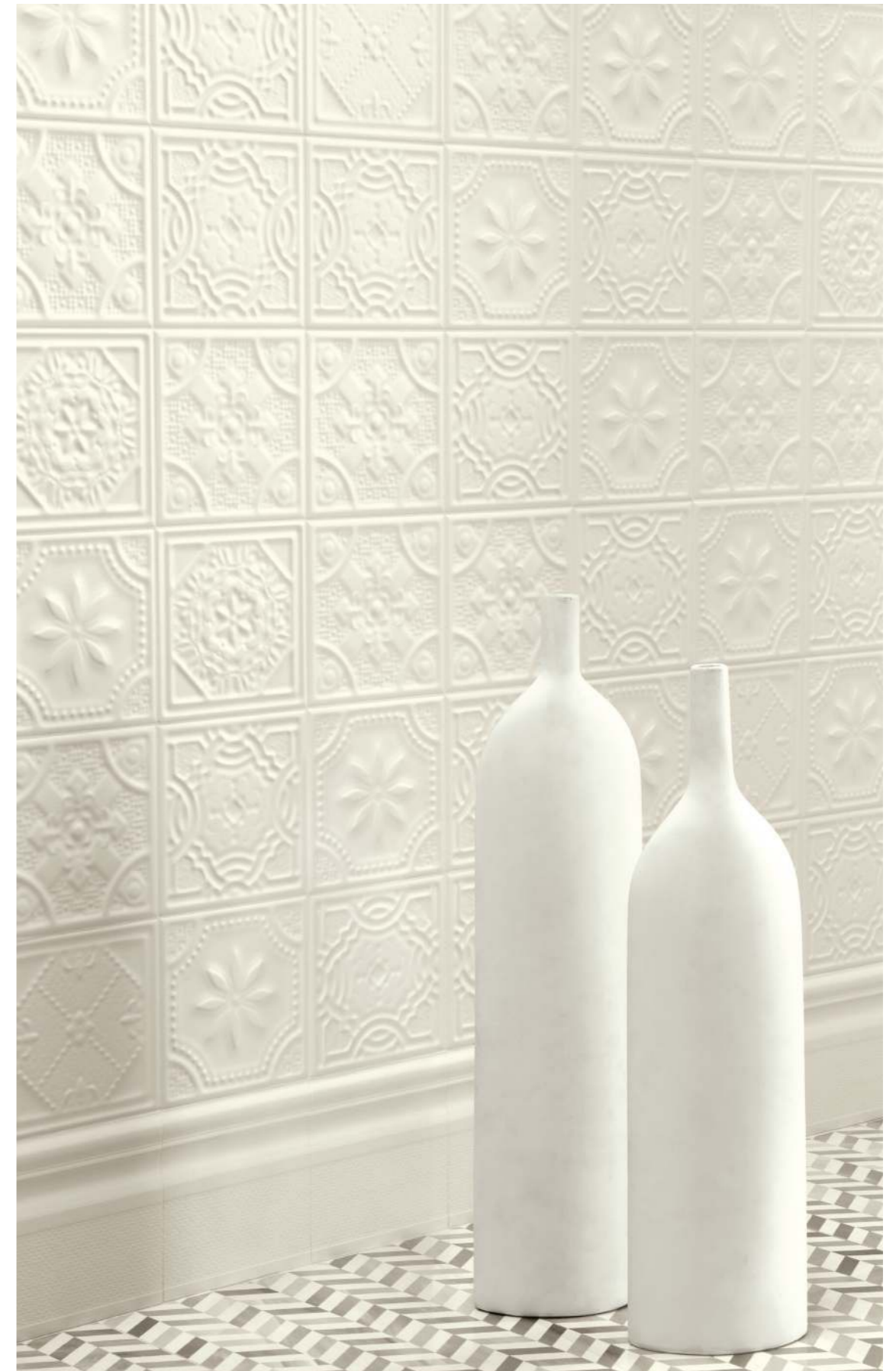
WALL - 15X15 / 5,9"X5,9" STUBE - ALZATA FLOOR - SIMILA 60X120 / 23,6"X47,2" LUSSO