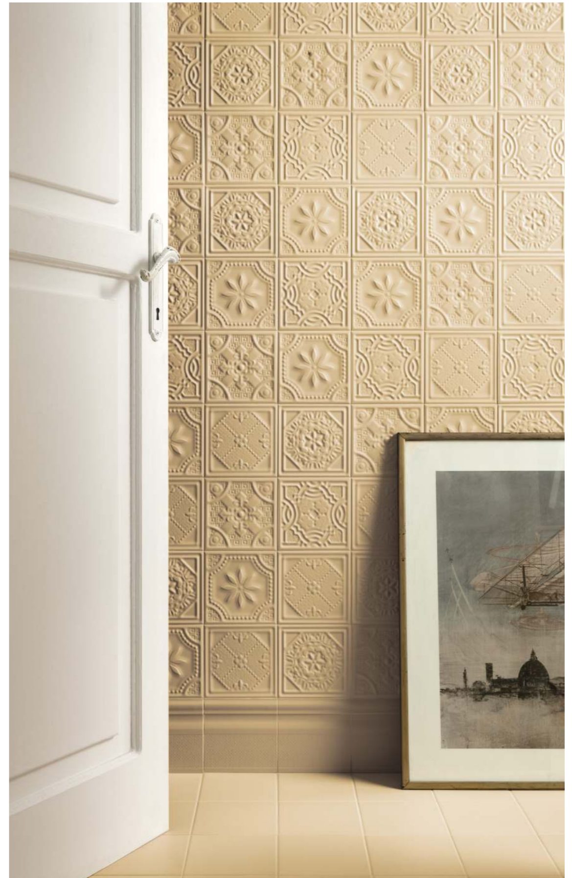
WALL - 15X15 / 5,9"X5,9" STUBE - ALZATA FLOOR - 15X15 / 5,9"X5,9" SOFFIO ALBICOCCA