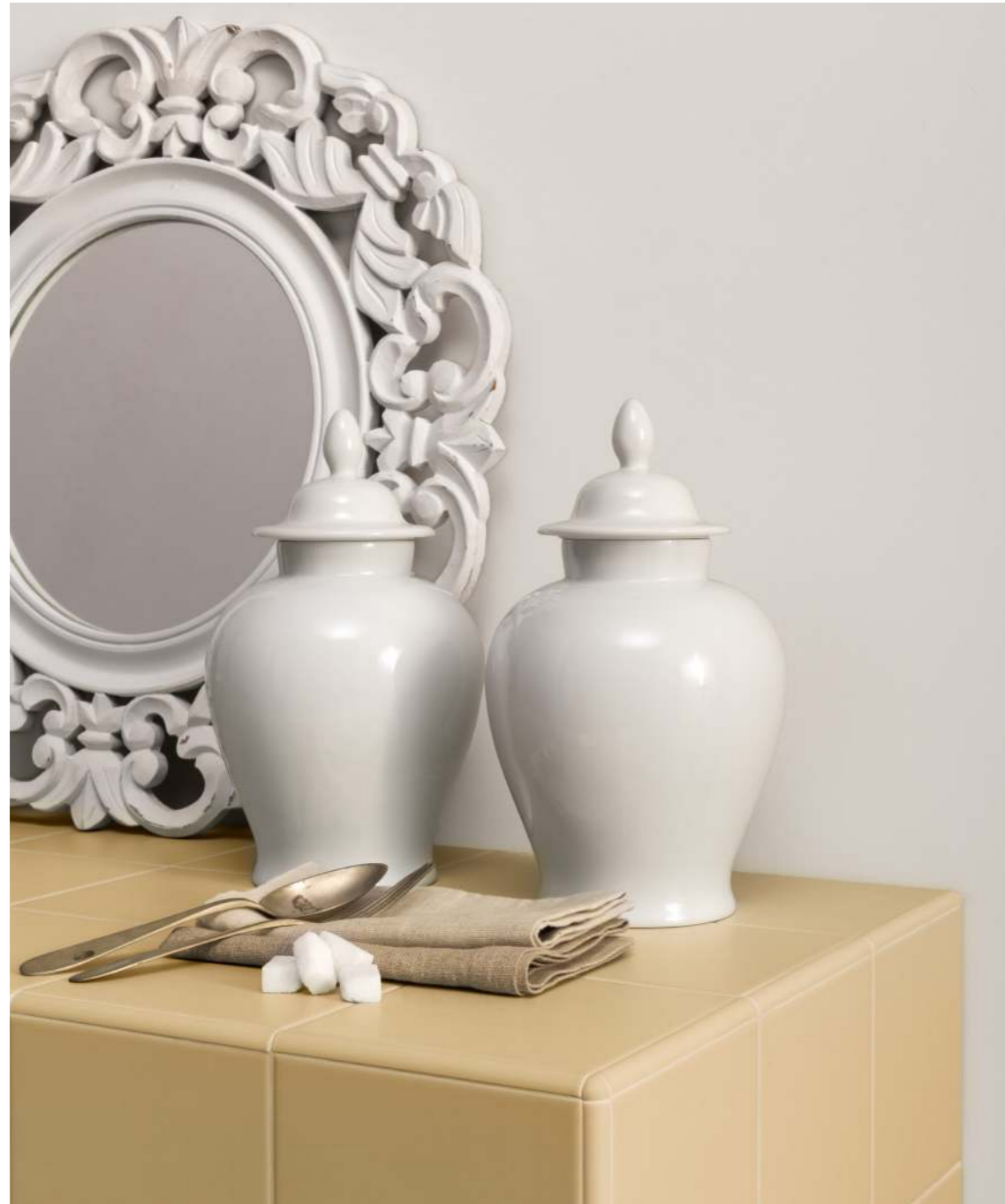
15X15 / 5,9"X5,9" SOFFIO ALBICOCCA - COPRIFILO 1X15 / 0,4"X5,9" + ANGOLO