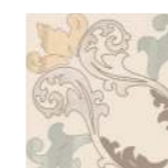
6001081 DECOR 45

MONOPOROSA IN PASTA BIANCA - WHITE BODY SINGLE FIRED