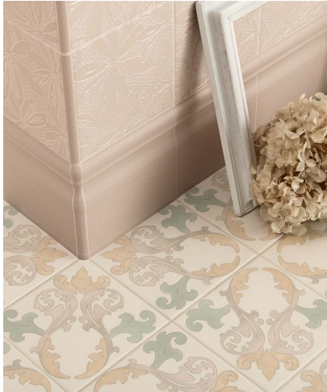
WALL - 15X15 / 5,9"X5,9" DECORO LIF - ALZATA + ANGOLO - COPRIFILO 1X15 / 0,4"X5,9" FLOOR - 15X15 / 5,9"X5,9" DECOR