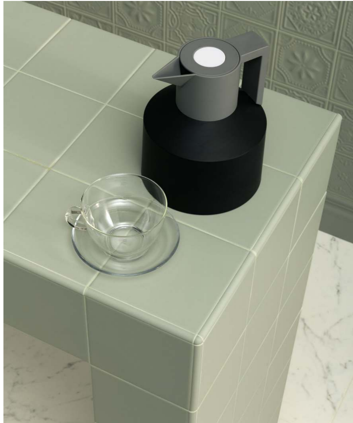
15X15 / 5,9"X5,9" SOFFIO SALVIA - STUBE - COPRIFILO 1X15 / 0,4"X5,9" + ANGOLO