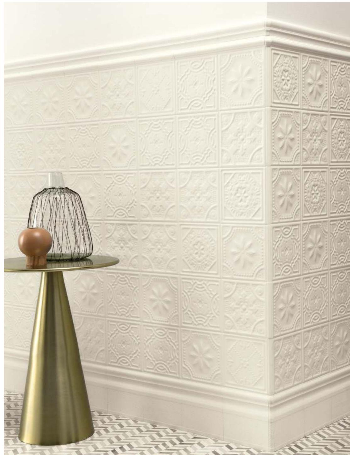
15X15 / 5,9"X5,9" STUBE - ALZATA + ANGOLO - MATITA 2,4X15 / 0,8"X5,9" + ANG. - TORELLO 4X15 / 1,5"X5,9" + ANGOLO