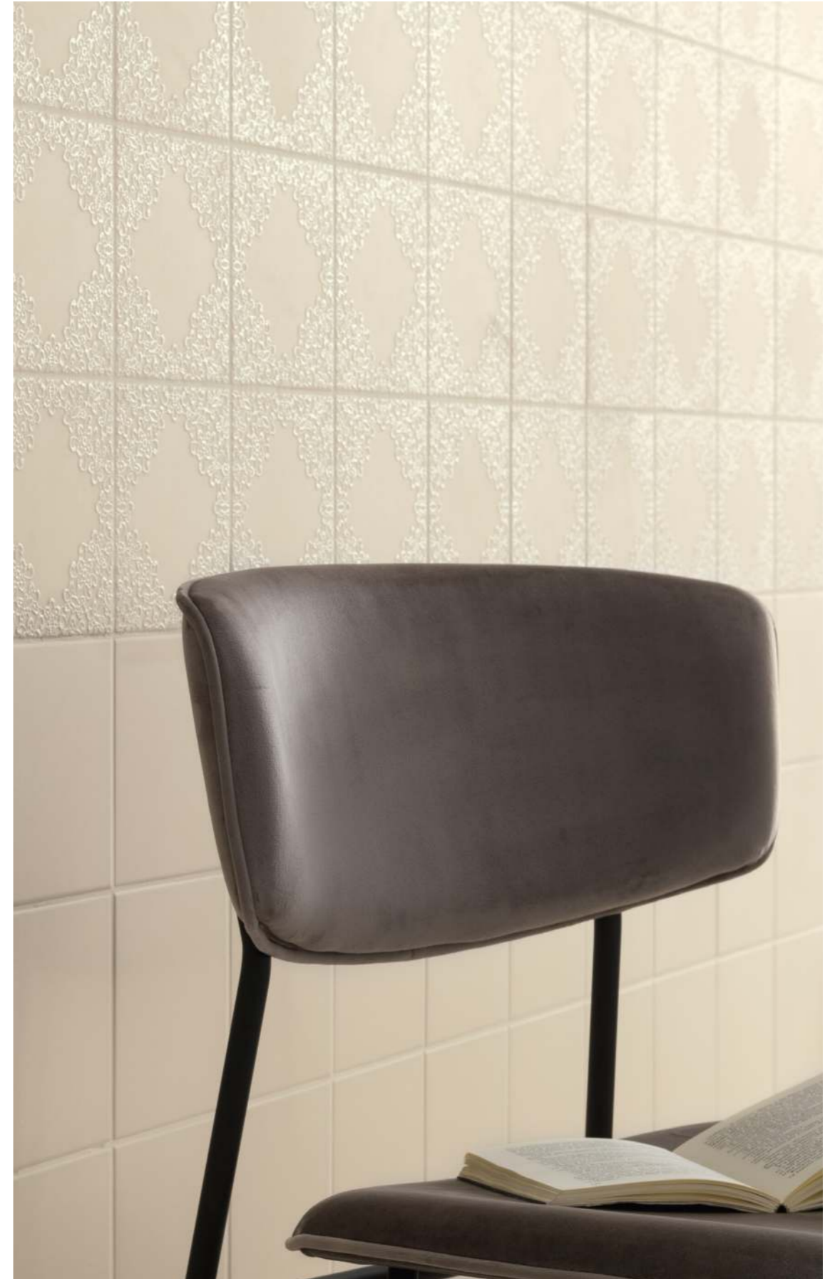
15X15 / 5,9"X5,9" SOFFIO SABBIA - DECORO DORA