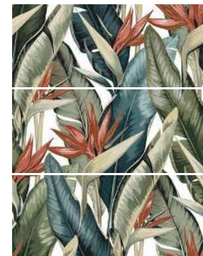
MANGO MULTI PANNO 01 60X75

Коллекция Mango: главный тренд – дерзкий тропический паттерн. Глянцевая поверхность, напоминающая ручную лепку, обеспечит необычные визуальные эффекты, а насыщенный оттенок спелого манго и сияющий белый с имитацией мелкоформатной плитки в сочетании с керамогранитом «под дерево» позволяют экспериментировать с цветом и настроением. Панно из 3 плит дополнит замысел: тропический цветок стрелиция, обрамленный зеленым и хаки, украсит любую вертикальную поверхность. Важно, что панно стыкуется и по вертикали, и по горизонтали – это дает возможность выкладывать его на большую площадь.