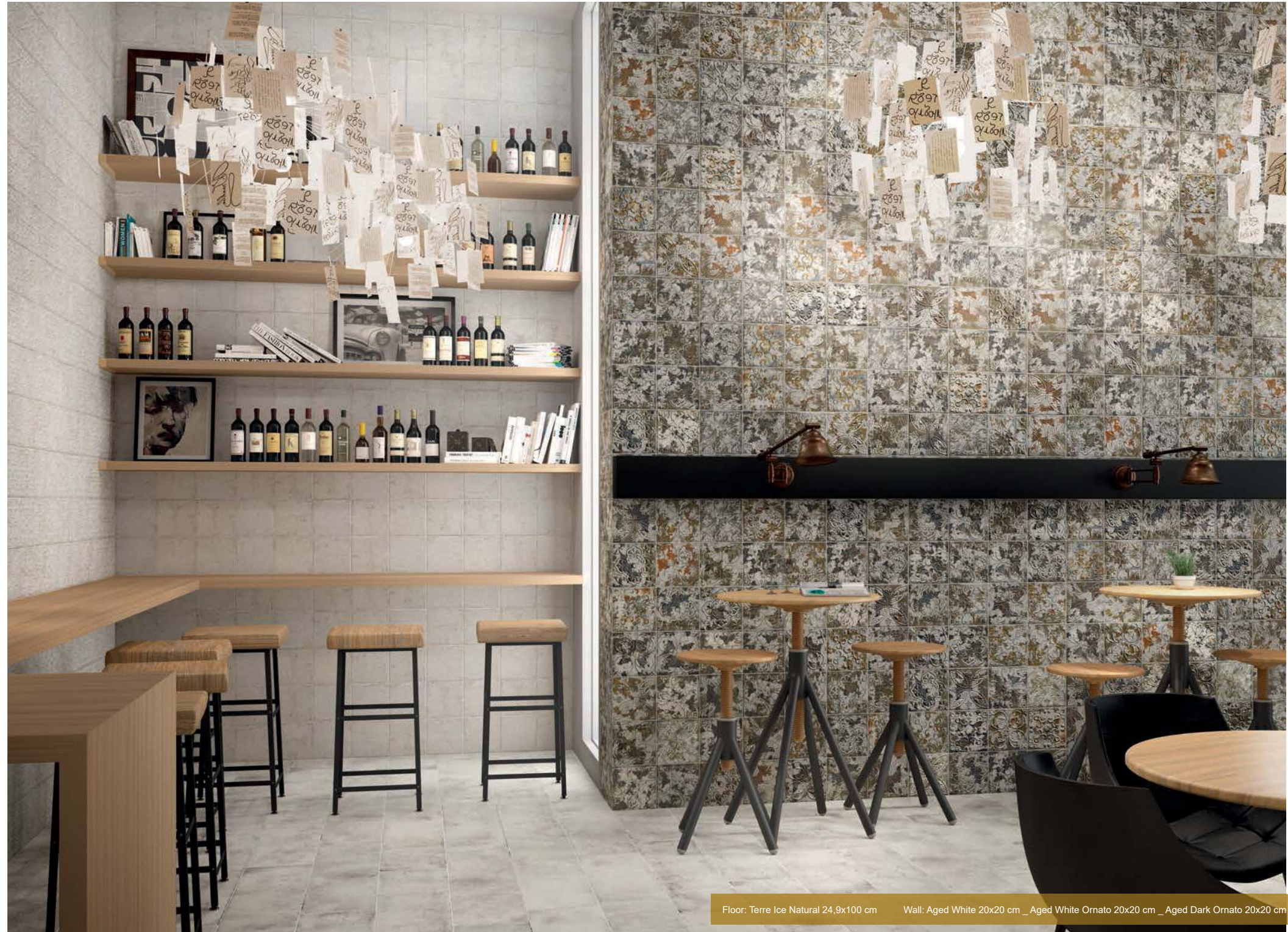
Floor: Terre Ice Natural 24,9x100 cm Wall: Aged White 20x20 cm _ Aged White Ornato 20x20 cm _ Aged Dark Ornato 20x20 cm