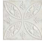
Aged White Ornato * 20x20 cm C-430