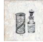
Aged Bath Decor ** 20x20 cm C-80