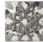
Aged Decor* 20x20 cm C-345

*Aged Decor is available in 3 different aleatory patterns. Aged Decor está disponible en 3 relieves diferentes aleatorios.