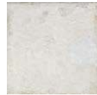
Aged White 20x20 cm C-430