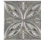
Aged Silver Ornato * 20x20 cm C-320