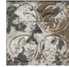
Aged Dark Ornato * 20x20 cm C-515