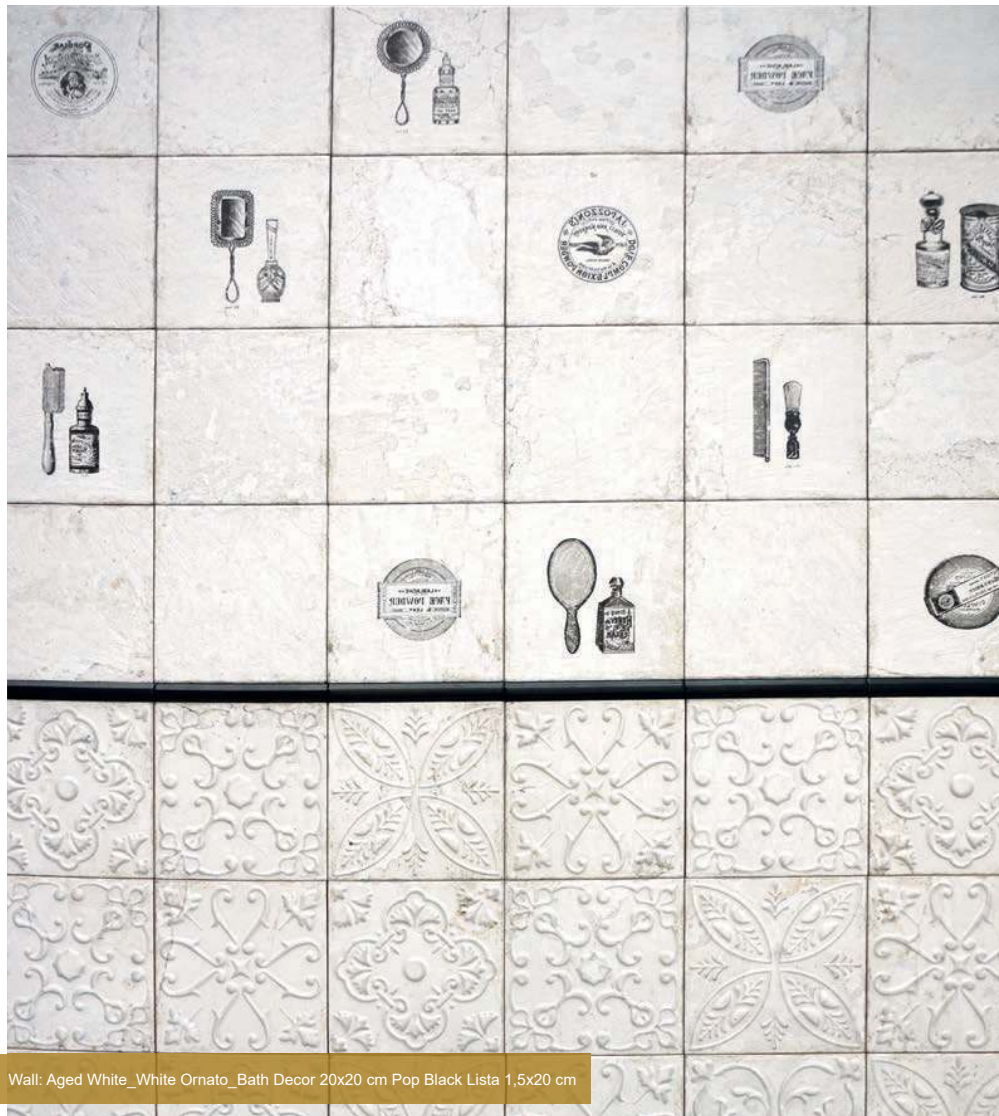
Wall: Aged White_White Ornato_Bath Decor 20x20 cm Pop Black Lista 1,5x20 cm