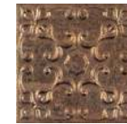
Aged Copper Ornato * 20x20 cm C-320