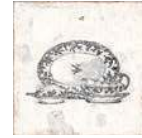
Aged Kitchen Decor ** 20x20 cm C-80