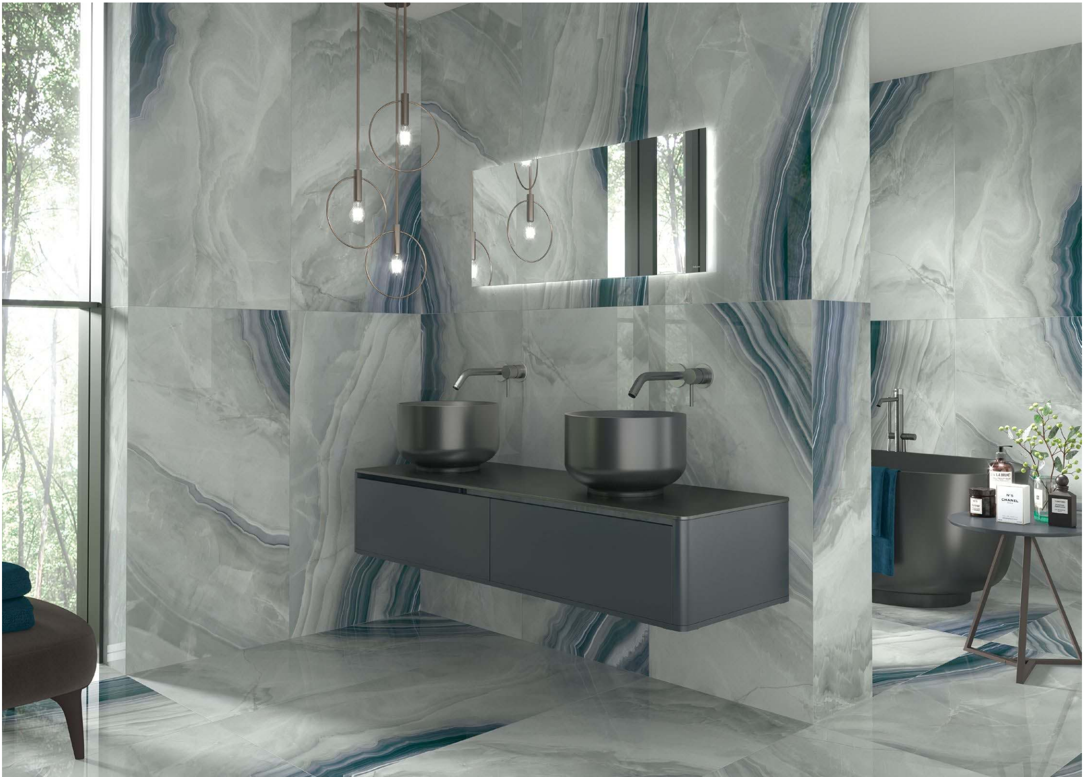
PERSIAN ONIX POLISHED RECT. 60X120