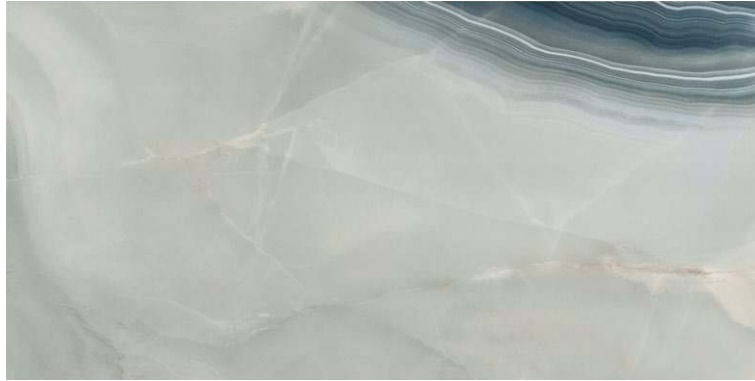
PERSIAN ONIX POLISHED RECT 60X120 / 24"X48" P34/M