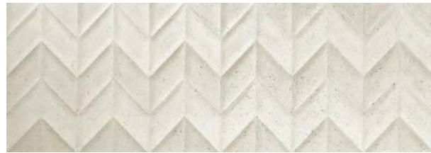
Dover Spiga Arena

31,6 cm x 90 cm · P3470756 / 100155613 · G261