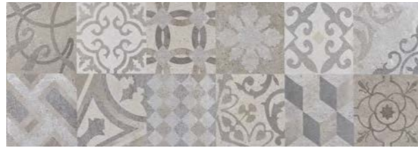
Dover Antique 31,6 cm x 90 cm · P3470757 / 100155610 · G271