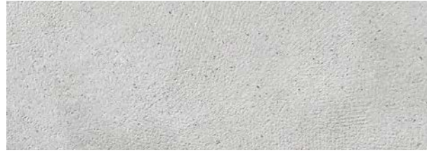
Dover Acero 31,6 cm x 90 cm · P3470759 / 100155567 · G261