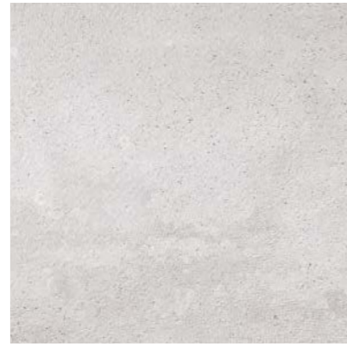
Dover Caliza 80 cm x 80 cm · P1760084 / 100155621 · G369 59,6 cm x 59,6 cm · P1856955 / 100155620 · G354