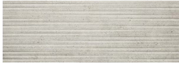
Dover Modern Line Acero

31,6 cm x 90 cm · P3470759 / 100155567 · G261