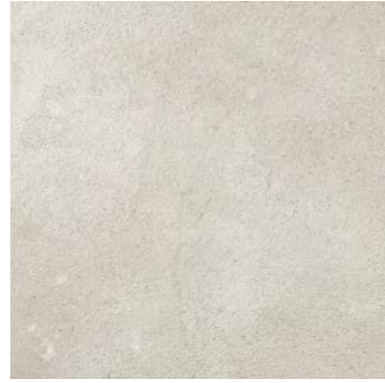
Dover Arena 59,6 cm x 59,6 cm · P1856954 / 100155614 · G354