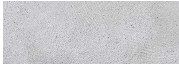
Dover Acero 31,6 cm x 90 cm · P3470759 / 100155567 · G261