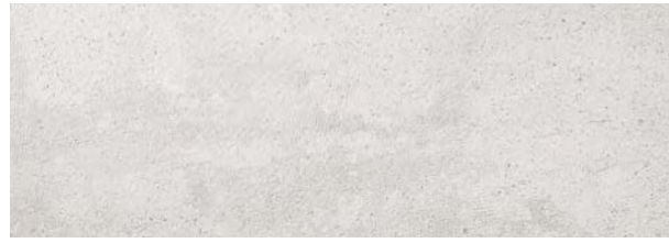
Dover Caliza 31,6 cm x 90 cm · P3470758 / 100155616 · G261