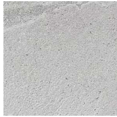
Dover Acero 80 cm x 80 cm · P1760081 / 100155569 · G369 59,6 cm x 59,6 cm · P1856952 / 100155568 · G354