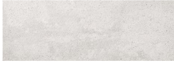
Dover Caliza 31,6 cm x 90 cm · P3470758 / 100155616 · G261