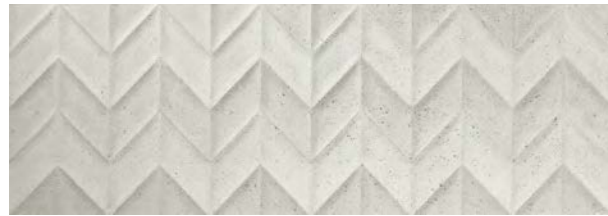
Dover Spiga Acero 31,6 cm x 90 cm · P3470775 / 100155972 · G271