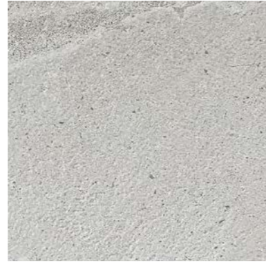
Dover Acero 80 cm x 80 cm · P1760081 / 100155569 · G369 59,6 cm x 59,6 cm · P1856952 / 100155568 · G354