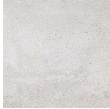
Dover Caliza 80 cm x 80 cm · P1760084 / 100155621 · G369 59,6 cm x 59,6 cm · P1856955 / 100155620 · G354