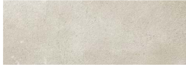
Dover Arena 31,6 cm x 90 cm · P3470756 / 100155613 · G261