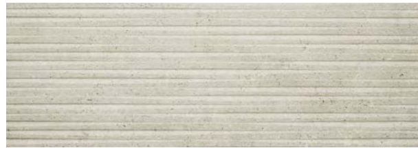
Dover Modern Line Arena

31,6 cm x 90 cm · P3470756 / 100155613 · G261