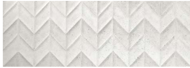
Dover Spiga Caliza 31,6 cm x 90 cm · P3470770 / 100155975 · G271