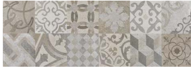
Dover Antique 31,6 cm x 90 cm · P3470757 / 100155610 · G271