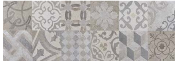
Dover Antique 31,6 cm x 90 cm · P3470757 / 100155610 · G271