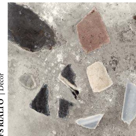
FS RIALTO | Decor