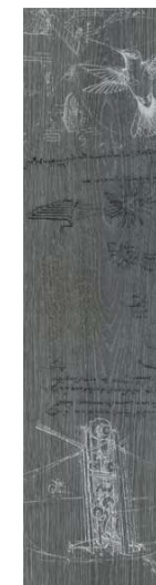
DD701000R\D Абете серый тёмный обрезной 20x80 Abete dark grey rectified