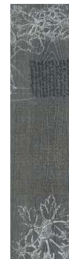
DD701100R\D Абете серый тёмный обрезной 20x80 Abete dark grey rectified