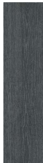
DD700900R Абете чёрный обрезной 20x80 Abete black rectified