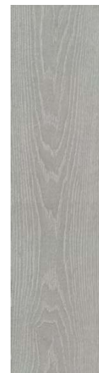
DD700600R Абете серый светлый обрезной 20x80 Abete light grey rectified