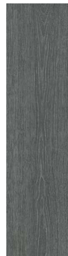
DD700800R Абете серый тёмный обрезной 20x80 Abete dark grey rectified