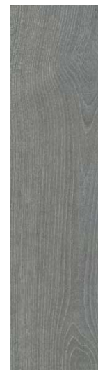
DD700700R Абете серый обрезной 20x80 Abete grey rectified