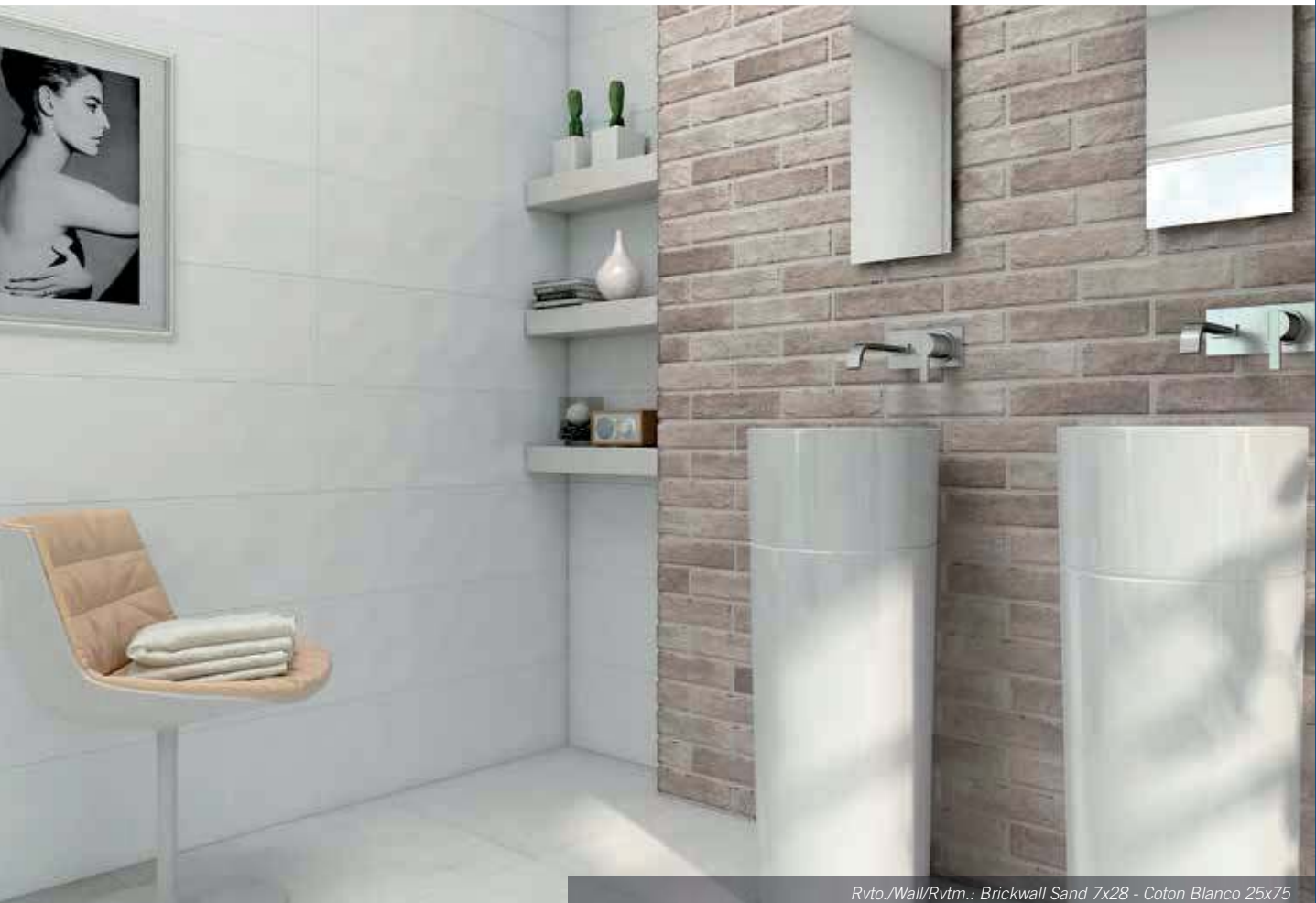
Rvto./Wall/Rvtrm.: Brickwall Sand 7x28 - Coton Blanco 25x75 Pvto./Floor/Sol: Style Marfil Decorstone 60x60