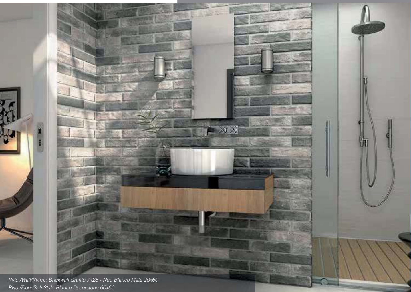
Rvto./Wall/Rvtrm.: Brickwall Grafito 7x28 - Neu Blanco Mate 20x60 Pvto./Floor/Sol: Style Blanco Decorstone 60x60