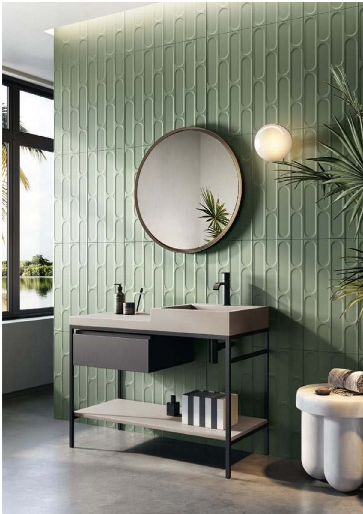
Salvia 30,2x60,4 - 12"x24" Naturale/Rettificato