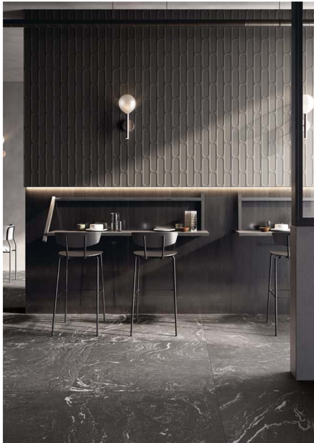
Pece 30,2x60,4 - 12"x24" Naturale/Rettificato