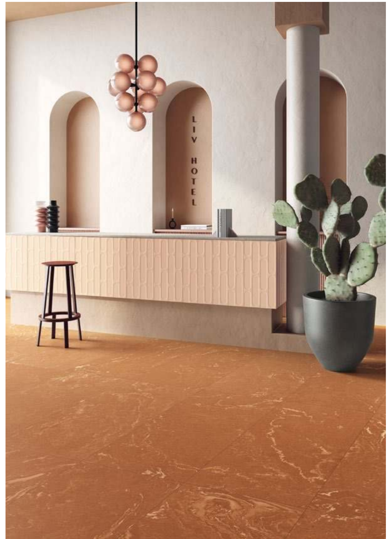
Cipria 30,2x60,4 - 12"x24" Naturale/Rettificato