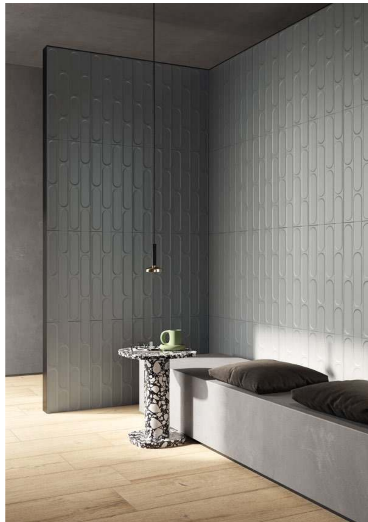
Cenero 30,2x60,4 - 12"x24" Naturale/Rettificato