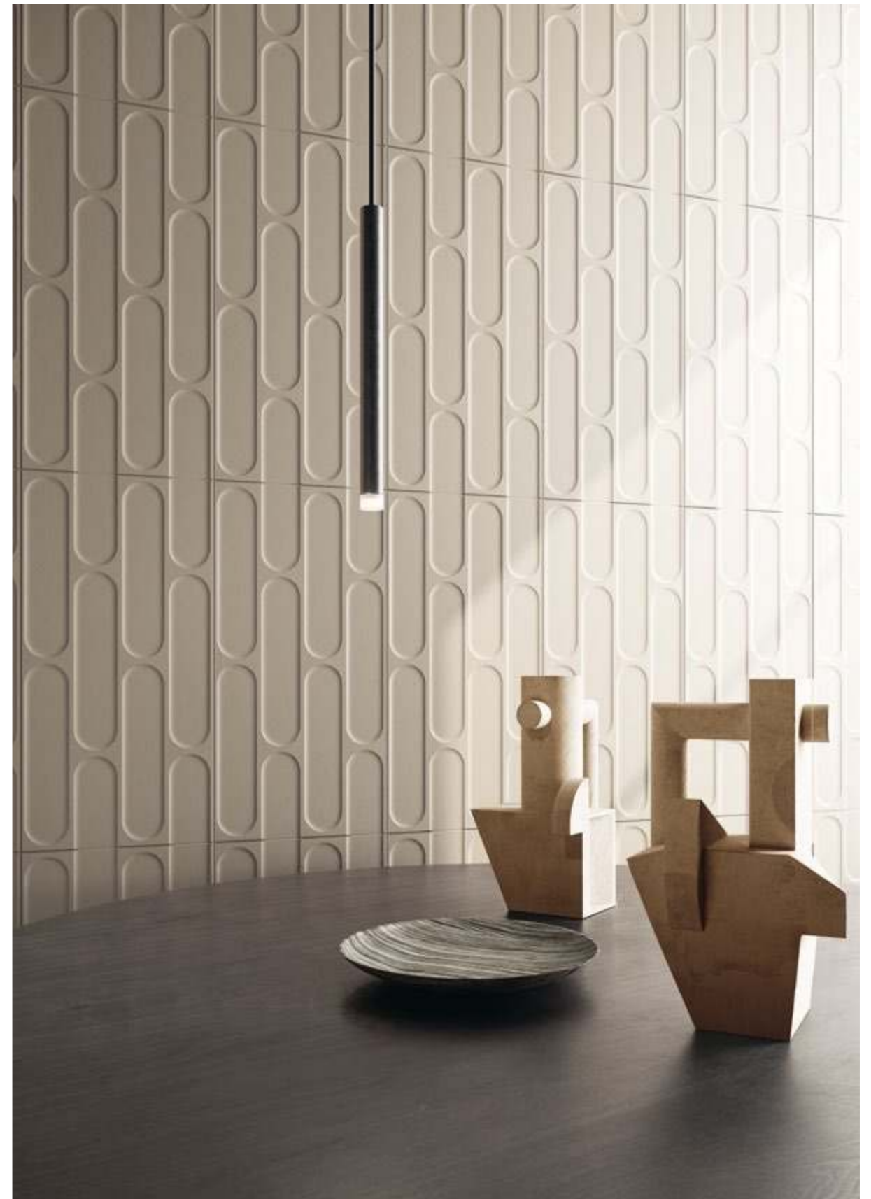
Avorio 30,2x60,4 - 12"x24" Naturale/Rettificato