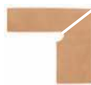
ZANQUÍN VIERTEAGUAS CORTE DU-191372 Drcho. DU-192372 Izdo. 310 x 270 x 86