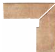
ZANQUÍN RECTO EVO DU-152372 Drcho. DU-153372 Izdo. 305 x 270 x 86