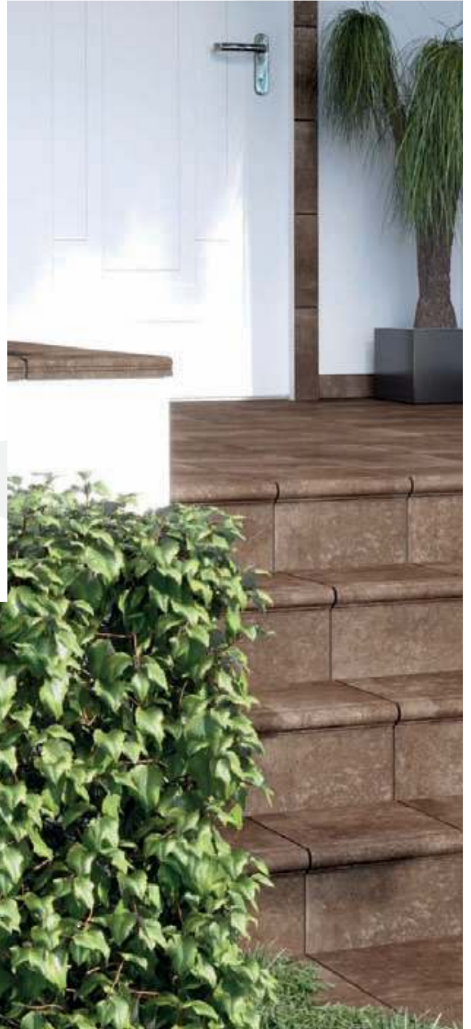
LAREDO. BASE 310 x 310. PELDAÑO FIORENTINO. MOLDURA RECTA II. RODAPIÉ, ZANQUÍN Y PASAMANOS.