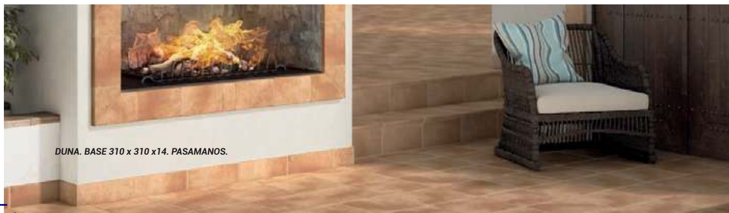
DUNA. BASE 310 x 310 x 14. PASAMANOS.