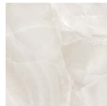
Pav Java 45 x 45 CM