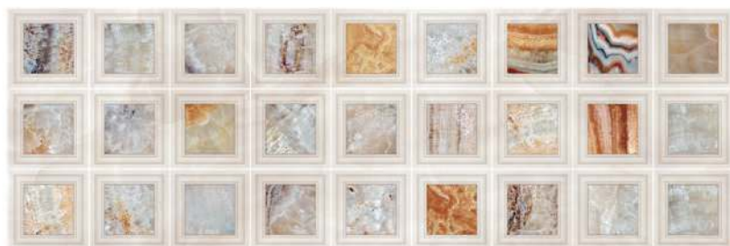
Frame Java 32 x 96 CM