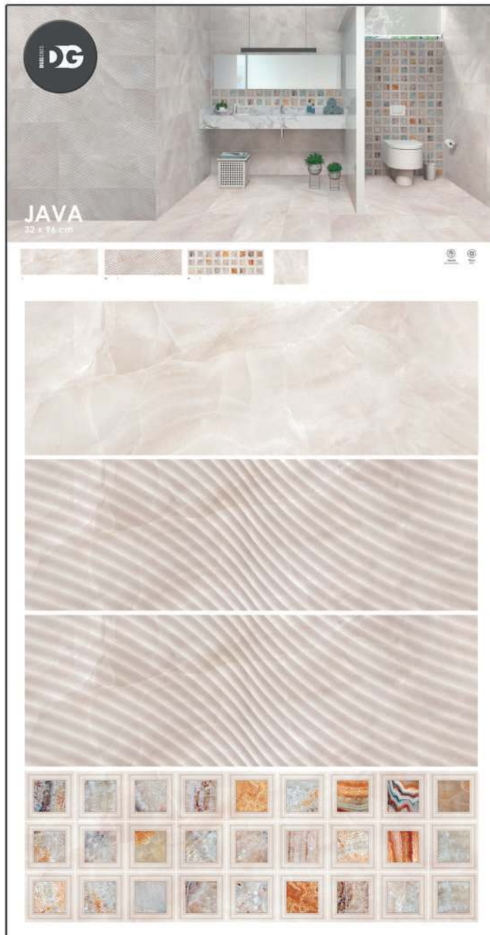
D20_019 · PANEL JAVA