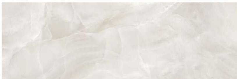
Java 32 x 96 CM