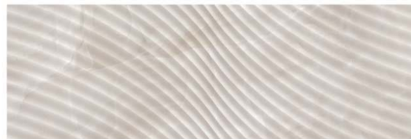
Dune Java 32 x 96 CM