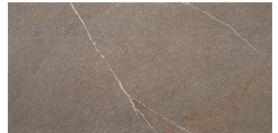
Udine Natural 60x120 R