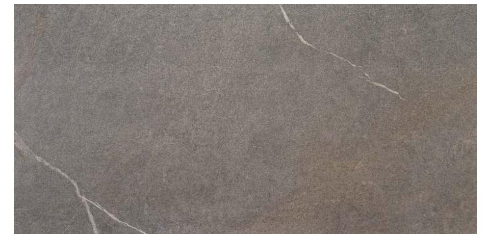
Udine Gris 60x120 R