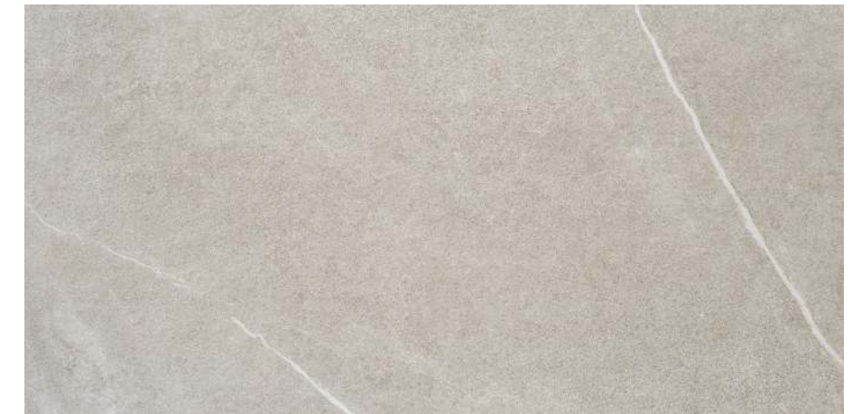
Udine Ceniza 60x120 R