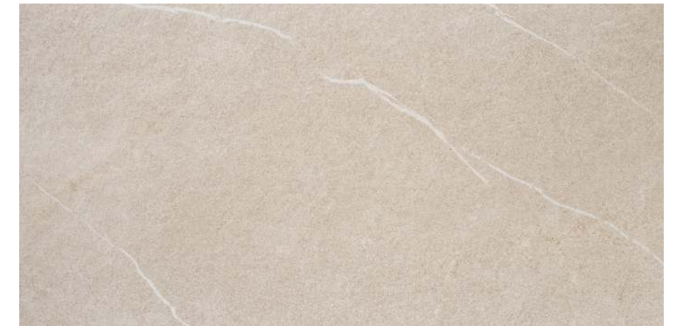
Udine Arena 60x120 R