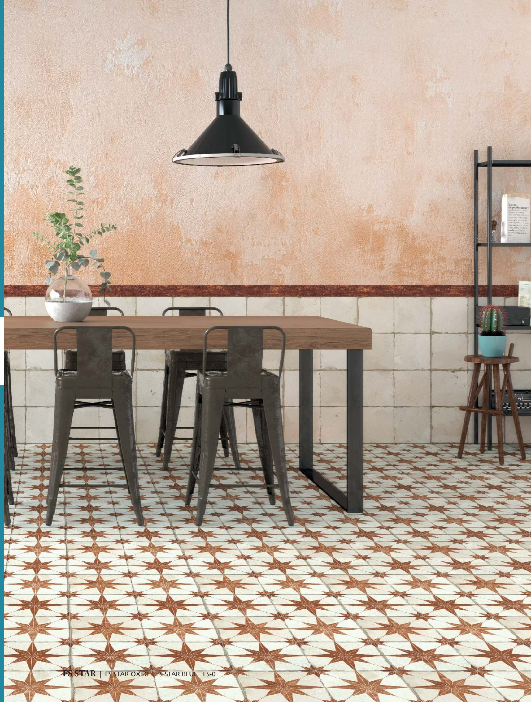
FS STAR Blue